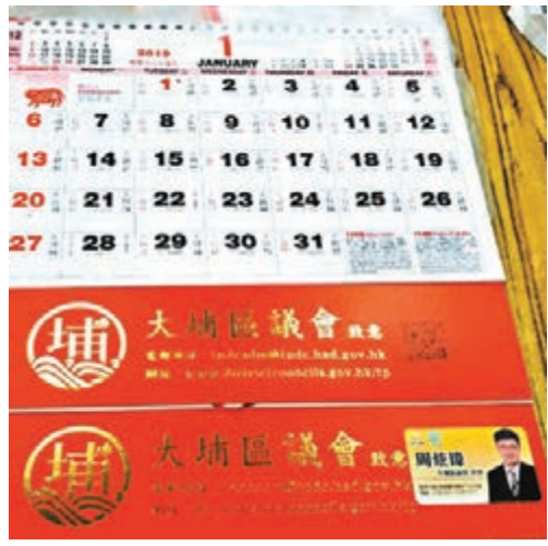
■蛇齋璋用自己張貼紙遮住大埔區議會嘅QR Code。fb截圖