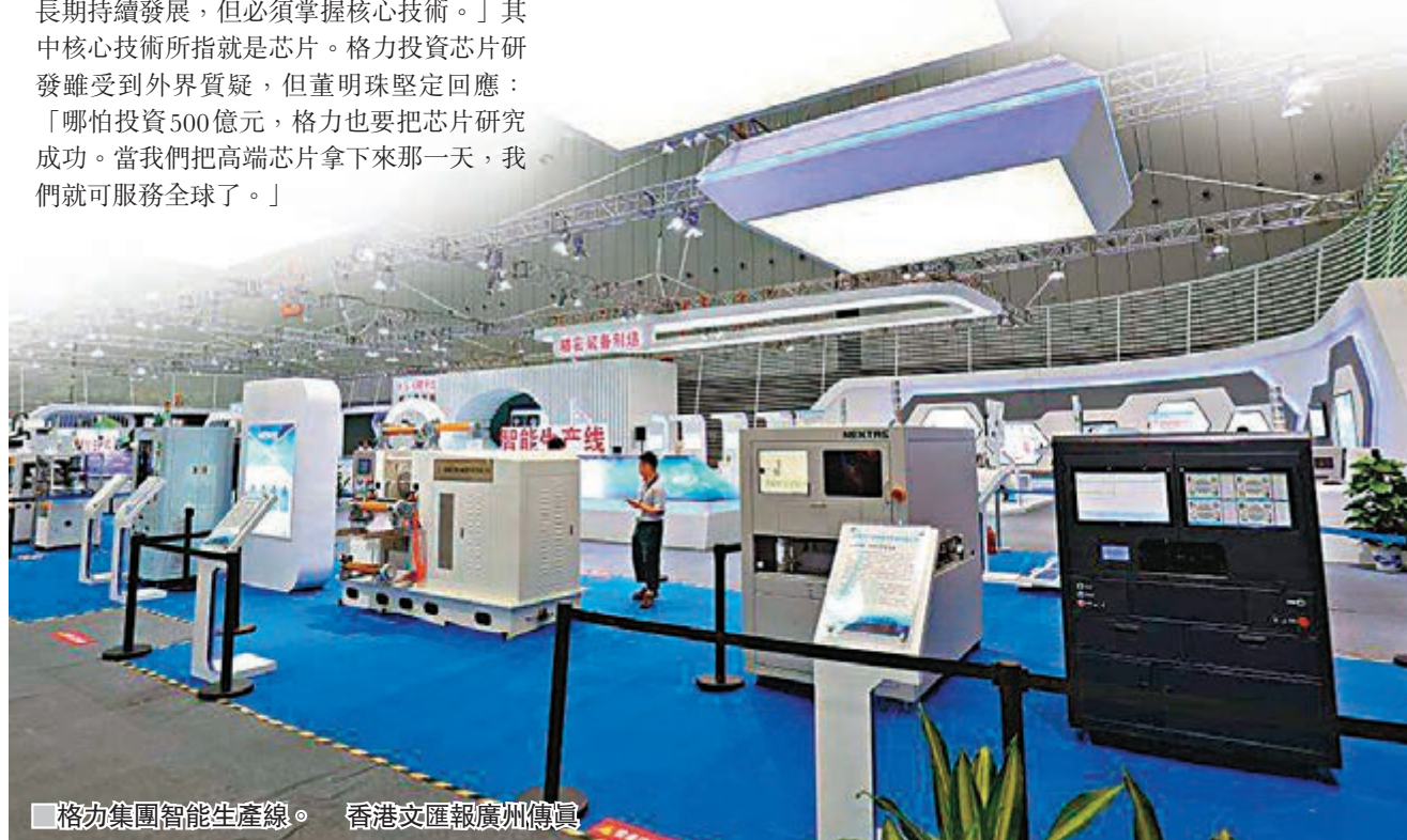
格力集團智能生產線。

針對振興實體經濟，廣東省各製造業企業應該掌握產業核心技術，堅持自主創新，努力實現產業關鍵環節自主化和核心技術的國產化，完成「廣東加工」、「廣東裝配」向「廣東製造」轉變，以及「廣東製造」向「廣東創造」轉變。