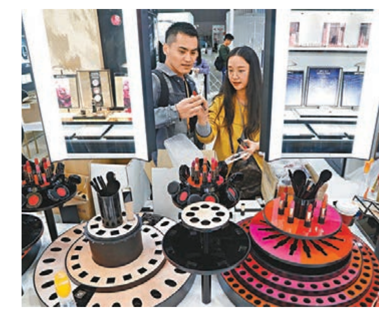
進博會全球好物雲集，中國跨境電商紛紛摩拳擦掌尋找商機。圖為參展商正在備展。

除了商業糾紛，也有貿易戰的因素在裡面。這一事件是美國長期以來、特別是貿易戰以來在知識產權問題上對中國的廣泛指責的一個典型案例，也是美國向中國施壓、敦促中國強化知識產權保護的一種手段。他續指，無論晉華事件本身的是否曲直如何，中國在知識產權保護方面都還有很大改進空間。中國對內要加強知識產權保護，增強企業的創新動機，從而促進高新技術產業的發展；對外也要尊重知識產權，減少與外國在知識產權保護方面的矛盾。