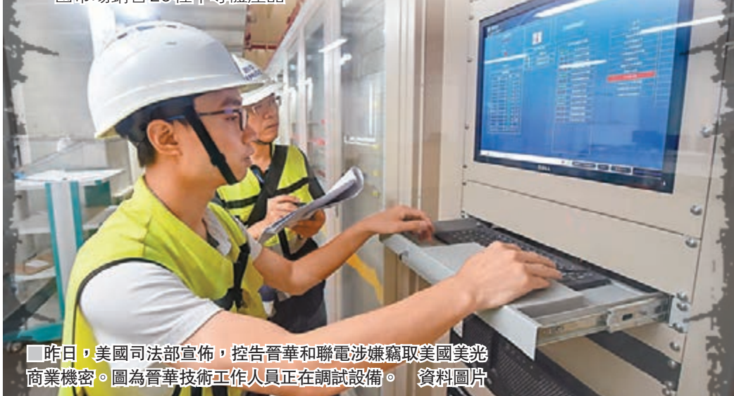
昨日，美國司法部宣佈，控告晉華和聯電涉嫌竊取美國美光商業機密。圖為晉華技術工作人員正在調試設備。

2018年7月 福建法院最終判斷美光在內地侵權聯電，並禁止美光在中國市場銷售26種半導體產品。