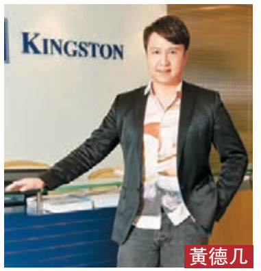
金力豐證券 研究部執行董事

中央積極推動綠色發展，今年開始實施生效《環境保護稅法》、《生態環境損害賠償制度改革方案》等環保政策，最近生態環境部再公佈《關於生態環境領域進一步深化「放管服」改革，推動經濟高品質發展的指導意見》，利好行業發展。