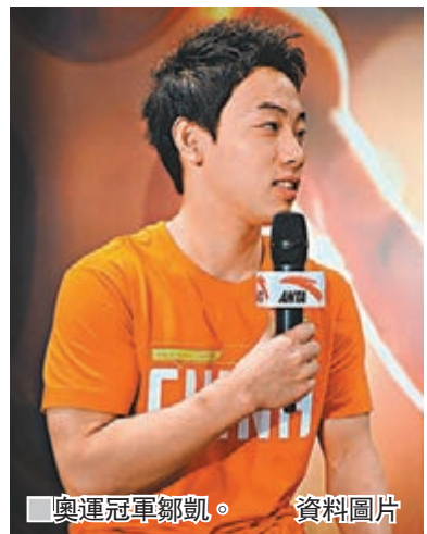
奧運冠軍鄒凱。資料圖片