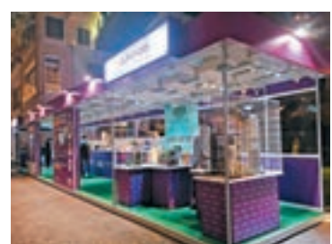
■ 灣仔利東街中庭展覽

社區建設一向為城市熱話，無論是新社區發展、區內設施配套，抑或舊區重建，均與市民息息相關。香港測量師學會（學會）舉辦「細看社區歷史 構建『你』想灣仔」地區發展創作比賽2018，旨在使年輕一代了解測量師在城市發展、保育及重建中擔當的角色及貢獻，同時鼓勵學生觀察和思考身邊社區的環境、政策和管理，帶出可持續發展的重要性。學會在灣仔利東街中庭舉行展覽，介紹學會及測量行業之餘，亦會展出得獎的3D模型及多媒體影片。