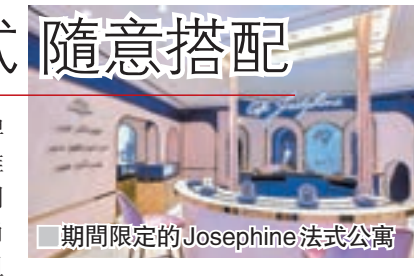
■ 期間限定的 Josephine 法式公寓

法國殿堂級珠寶品牌 CHAUMET 為慶祝推出全新 Josephine 系列珠寶款式，把優雅時尚的法式公寓帶到尖沙咀「1881」，讓大家親身體驗與別不同的法式生活態度。期間限定的 Josephine 法式公寓重新演繹約瑟芬皇后的優雅居停，呈現拿破崙時代的皇室生活品味，尤其是穿過拱門來到 Cafe Josephine，可以在環形戒指吧枱小憩，又可以根據個人風格隨意搭配戒指，創作出專屬的戒指組合。