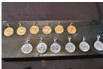
■ 全新12星座吊墜系列