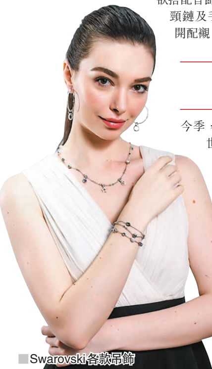
■ Swarovski 各款吊飾

早前，周大福為慶祝體驗店開業一周年，舉行以拼湊自主個性為主題的慶祝活動——「Create Your Style」，並率先推出獨家專款「Klingkling」系列。例如，Klingkling Soda系列沿用飲品蘇打的構思，既是配角又可獨當一面，如水般透徹卻能刺激你味蕾，簡單而率性。現在，用最簡約的配飾，已經能展現到最真我的個性。同時，Klingkling Duo & Trio 以七彩的色彩被混合調和，調配出迷人多變的雞尾酒，如女性千變萬化的形象，主張客人隨心所欲搭配首飾，其中頸鏈更可一分为二成為頸鏈及手鏈，而耳環和長吊飾亦可分開配襯，自由帶出不同風格。