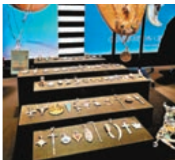
■ Kingdom of Dreams