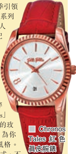
■ Chronos Tales 紅色真皮腕錶

Folli Follie 在今季引領秋冬潮流，推出一系列藍色及酒紅色的迷人配飾，讓你隨心配襯日夜造型。例如，全新推出的「Lifetime Ora」設計匠心獨運，典雅的圓形錶殼配以數字錶盤和紅色細節，而簡約純粹的「Chronos Tales」則優雅脫俗，典雅的玫瑰金色錶殼細節，為你打造魅力長青的風格。若你喜歡優雅的款式，不妨考慮以精鋼橢圓形錶殼搭配羅馬錶盤的藍色「Metal Chic」腕錶，讓藍色成為你今季的時尚顏色。