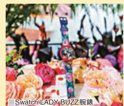
■ Swatch LADY BUZZ 腕錶

Swatch 一向熱愛將藝術帶給大家，今次再度履行承諾，與國際知名藝術博物館合作，將他們的著名藝術作品重新演繹，首次以具歷史價值的藝術傑作為基礎，並加入巧奪天工的現代元素，創作出三款猶如腕上畫布般的全新手錶，這三款手錶均來自2018年秋冬Worldhood系列，而Rijksmuseum 藝術博物館的精品店自然成為銷售地點的首選。