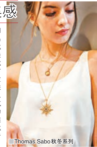
■ Thomas Sabo 秋冬系列

今季，Thomas Sabo 為 Charm Club 系列打造全新面貌，其秋冬 Sterling Silver 新品系列更引領了首飾佩戴的新風尚：錯搭將成為全新潮流，營造出強烈、真實而自信的美感。創意風格搭配的基礎是以全新設計的戒指、項鏈和掛墜盒等主打首飾，以層次豐富的佩戴方式為傳統的首飾套裝進行了全新定義。例如，Kingdom of Dreams 採用了代表皇家風範的色調，擁有雍容華貴的質感，以夜空特有的迷人魅力賦予佩戴者非凡的氣場，同時以維多利亞時期風格為創意靈感的首飾中部分點綴有星星和月亮等元素，連同神秘的獨角獸吊墜等作品，以巨大造型成為引人注目的亮點，同時也是首飾收藏者不可缺少的傑作。