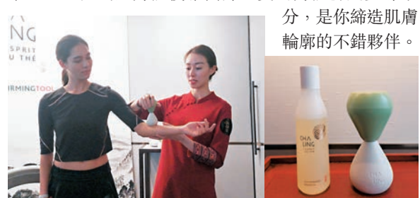
■ 大家可配以按摩油使用美體塑形神器，針對雙腿、臀部、腰部及腹部等部位，撫平、重塑及刻畫身體優雅曲線。

另外，繼刮痧美顏推出後，品牌同時糅合傳統中醫學美顏智慧及法式美學藝術，推出家用拔罐 Ba Guan。拔罐是一種在中醫學中極具接受性的傳統療法，這次品牌重新設計的這款家用拔罐，無須加熱，卻具備傳統拔罐的真空吸吮功能，更改良成美體塑形神器，特別針對雙腿、臀部、腰部及腹部等4大容易積聚脂肪部位，撫平、重塑及刻畫身體優雅曲線，更為身體排走多餘水分，是你締造肌膚輪廓的不錯夥伴。