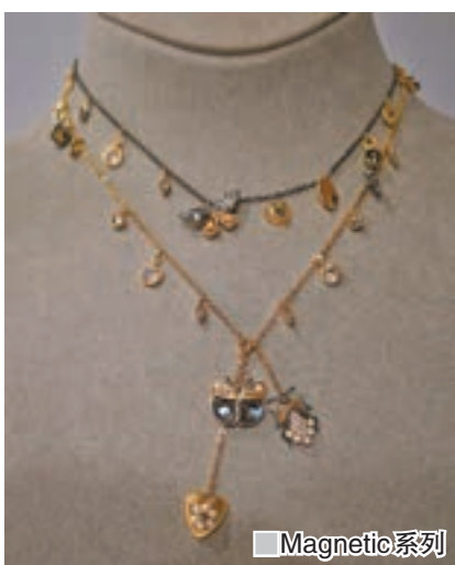
■ Magnetic 系列

今季，Swarovski 帶領女性走進迷人的自然世界，感受以「森林童話」為主題的神秘與璀璨魅力。大自然的美依然是品牌的靈感源泉，而今季系列更閃耀着童話般的夢幻光彩。例如，全新Magnetic系列以璀璨悅目的創新手法，重新演繹甲蟲、昆蟲等美感，利用品牌Pointiage 低溫陶瓷鑲嵌技術，時尚感十足的首飾，如不對稱耳環、單邊耳環、胸針、多層次項鏈、圖章戒指及雞尾酒戒指，皆散發出品牌水晶的奪目光彩，並融入了精緻講究的細節與多種金屬色調。