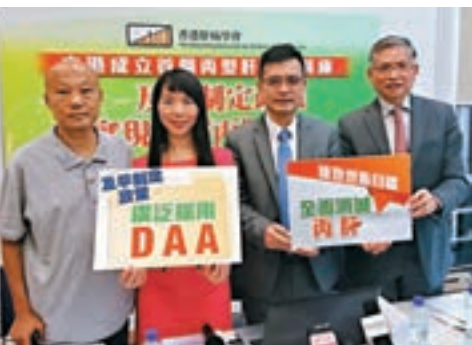
香港肝病學會要求政府制定長遠消除丙肝目標。

組合製劑，本身患有糖尿病及腎病的李先生亦曾經使用，他去年因末期腎衰竭而入院，原本獲安排緊急換腎，但檢查後發現體內帶有丙肝病毒，被醫生從候名單中移除，至完成丙肝治療後才重新列入候輪冊，原因為患有丙肝可能會增加移植後排斥機會及引致併發症。