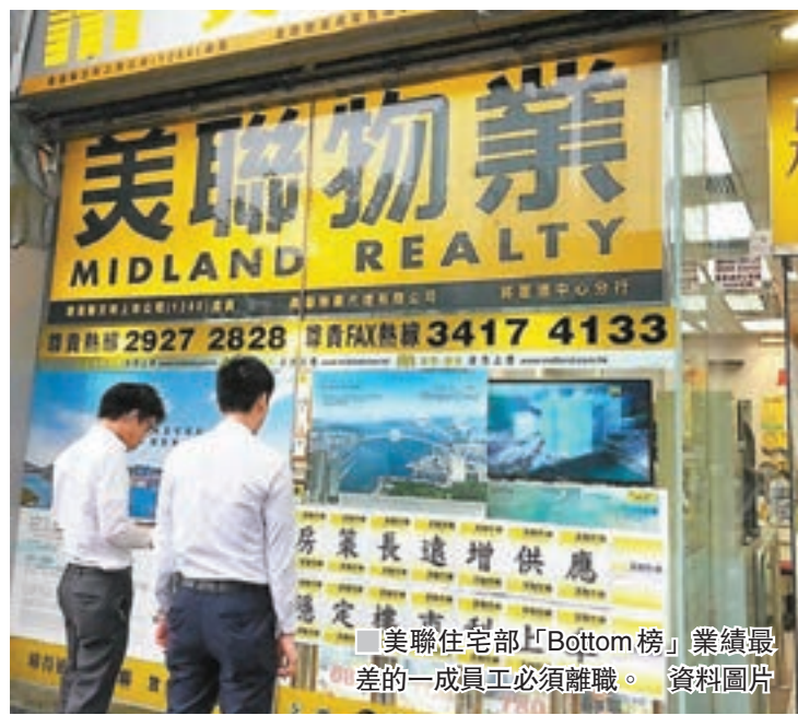
美聯住宅部「Bottom榜」業績最差的一成員工必須離職。

據地產代理監管局數字，截至今年9月30日，全港共有39,834名持牌地產代理，若果以9月份一二手樓成交合計約4,000宗計，即每10名持牌代理爭一單住宅買賣，生意難做。