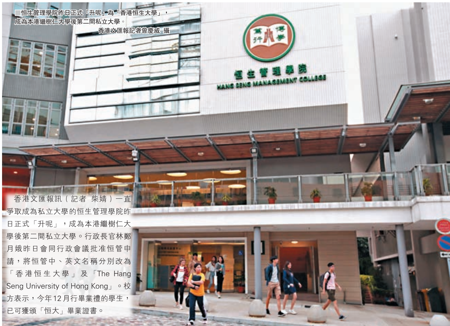
恒生管理學院昨日正式「升呢」為「香港恒生大學」，成為本港繼樹仁大學後第二間私立大學。