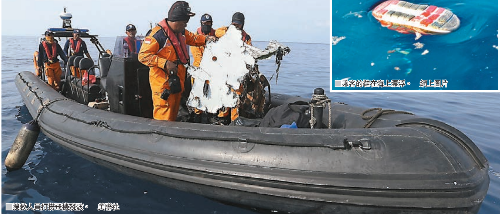
■ 搜救人員打撈飛機殘骸。

印尼昨日再次發生嚴重空難。印尼廉航獅子航空(Lion Air)昨晨一班由首都雅加達前往檳港的客機起飛後13分鐘，於雅加達以北對開海面墜毀，救援人員相信機上189人已經全部罹難，是當地自1997年以來最嚴重空難。印尼運輸安全委員會指出，出事客機非常先進，事發時天氣亦良好，現時未能確定空難原因。