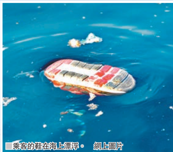
■ 乘客的鞋在海上漂浮。