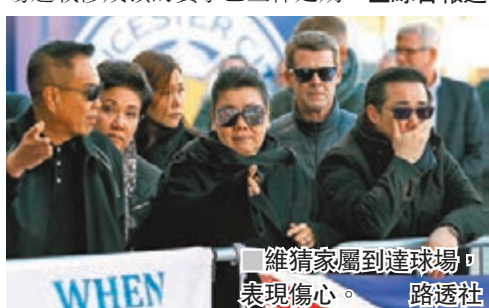
■ 維猜家屬到達球場，表現傷心。

球會聲明稱，世界失去一位偉大人物，形容維猜善良、慷慨，球會在他領導下成為一個大家庭。球員紛紛悼念維猜，前鋒華迪於網上貼出與維猜的合照，表示「無法形容當下感受」，讚揚維猜是球隊靈魂人物。大批球迷湧到王權球場外，擺放球隊圍巾、球衣、花束等物品悼念維猜。李斯特城原定今日在聯賽盃主場迎戰威爾的賽事已宣佈延期。