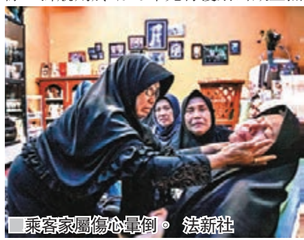
■ 乘客家屬傷心暈倒。

印尼有超過1.7萬個島嶼，極依賴航班連接各島嶼之間，印尼航空管制員協會去年揭發，雅加達的飛機升降量超出機場負荷，令意外風險增加。印尼過往空難頻生，美國和歐盟在2007年將當地所有航空公司列入黑名單，禁止它們進入領空，兩項禁令分別在2016年和今年初完全解除，獅航則於2016年先行獲剔除出歐盟黑名單。今次空難勢必再次打擊外界對印尼航空業的信心。