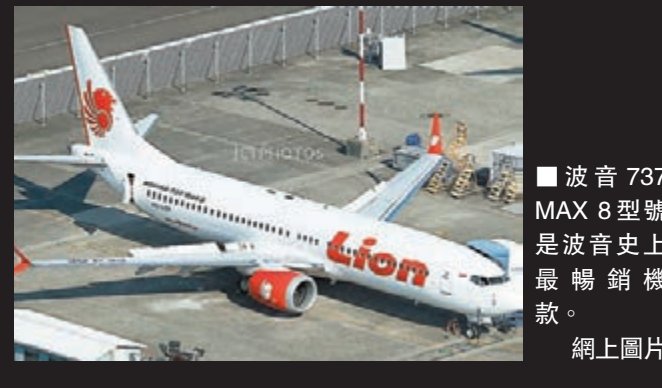
■ 波音737 MAX 8型號是波音史上最暢銷機款。