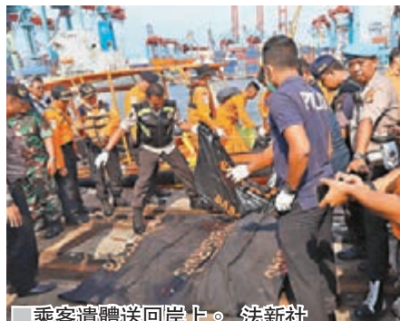
■ 乘客遺體送回岸上。

印尼獅航客機在海上墜毀後，當局派出300多名救援人員，到事發海面附近尋找客機和乘客下落。當局截至昨日傍晚仍未尋回客機主體，亦未發現生還者，但已有大批乘客隨身物品和機身碎片在海上漂浮，救援人員亦發現部分人體殘肢。