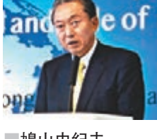
鳩山由紀夫