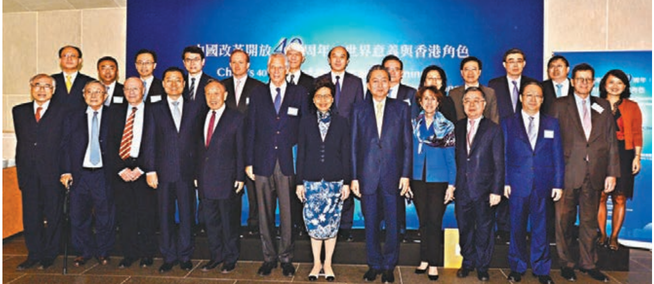
外交部駐港特派員公署與香港明天更好基金聯合舉辦「中國改革開放40周年：世界意義與香港角色」國際研討會，賓主合照。

香港文匯報訊(記者 鄭治祖) 今年是國家改革開放40周年，外交部駐港特派員公署昨日舉辦改革開放40周年國際研討會，探討改革開放的世界意義、香港的角色和未來機遇。特首林鄭月娥表示，香港是改革開放的貢獻者和受益者，隨着國家的不斷發展，香港渴望發揮比以往更大的作用，為進一步開放內地經濟提供試驗場，履行「促進者」和「推動者」的角色，包括推動創新及互聯互通，令更多人可以共享經濟發展成果。