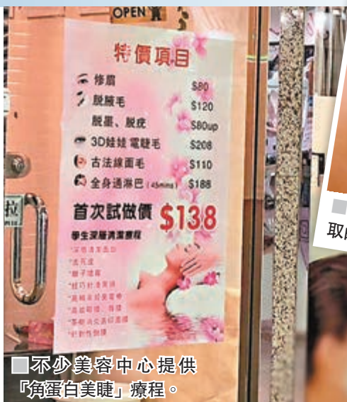
■不少美容中心提供「角蛋白美睫」療程。