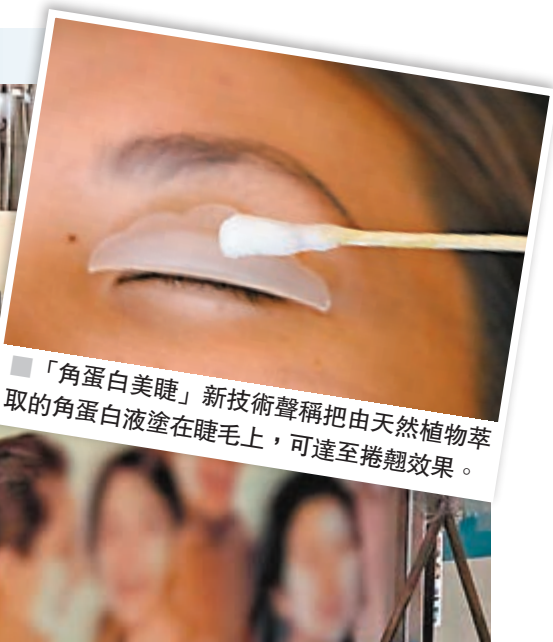
■「角蛋白美睫」新技術聲稱把由天然植物萃取的角蛋白液塗在睫毛上，可達至捲翹效果。