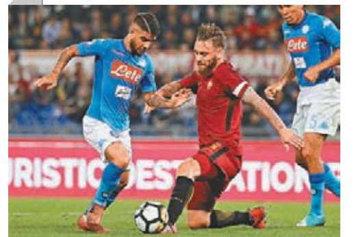
■羅馬中場迪羅斯(右)和拿坡里前鋒恩斯治尼，兩代意大利國腳角力。