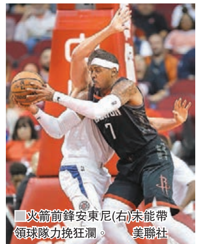
■火箭前鋒安東尼(右)未能帶領球隊力挽狂瀾。