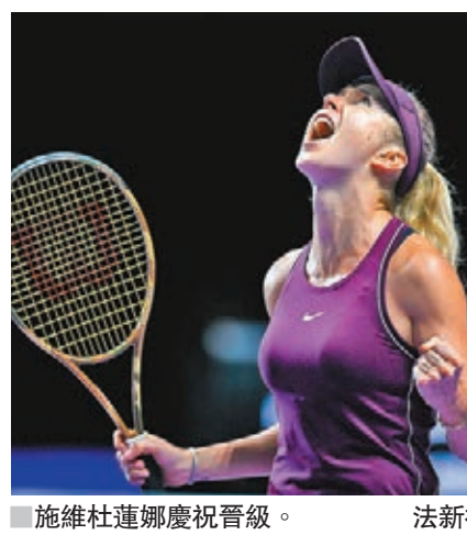
■施維杜蓮娜慶祝晉級。法新社