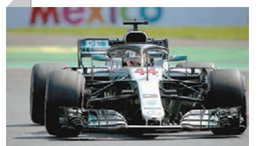
■咸美頓的戰車。