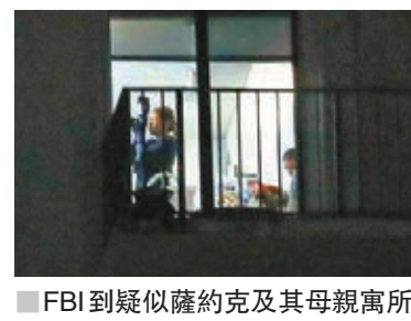
FBI到疑似薩約克及其母親寓所調查。