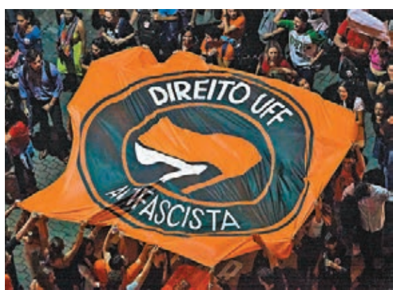
巴西民眾舉行反極右、反法西斯示威。