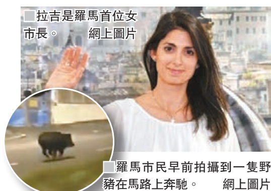
拉吉是羅馬首位女市長。