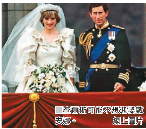
查爾斯可能不想迎娶戴安娜。