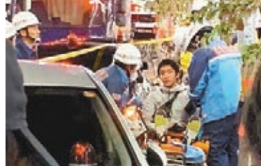
受傷民眾接受治療。