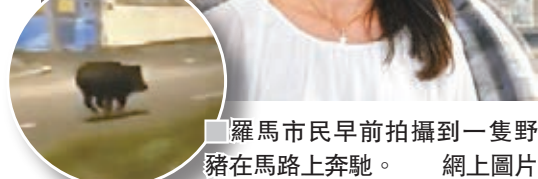
羅馬市民早前拍攝到一隻野豬在馬路上奔馳。