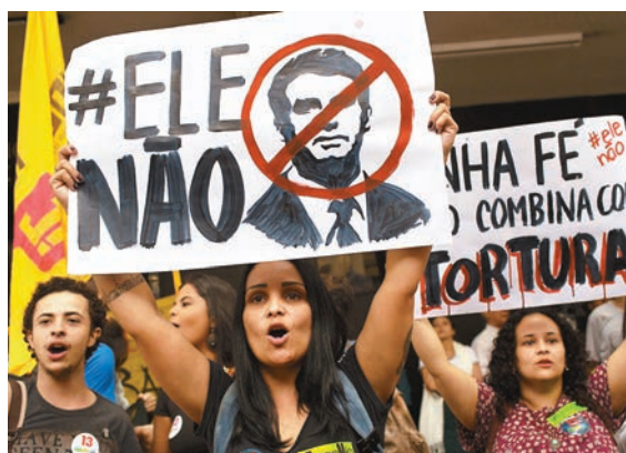
女大學生舉起寫上「不要是他」的標語反對博爾索納羅。