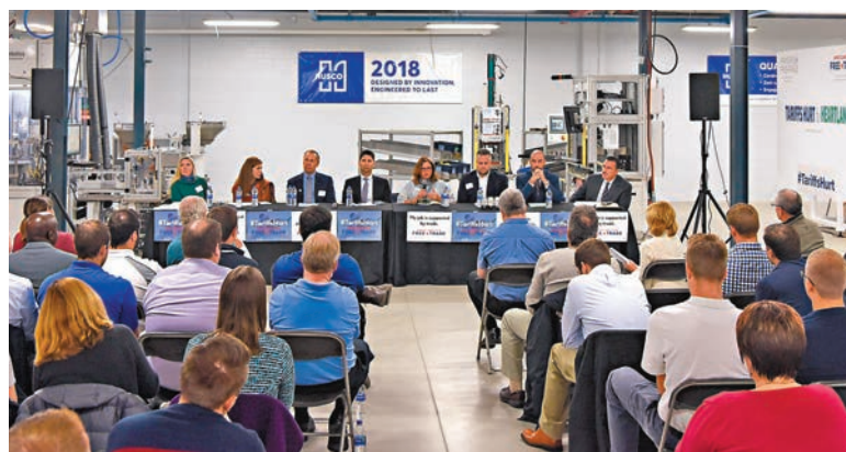
「關稅傷害美國腹地」組織在美國威斯康星州沃基沙市舉辦集會活動,百餘位當地工商界人士和普通民眾參加。

伊里斯特表示,許多製造業企業不僅是勞動密集型企業,也是資金密集型企業。購買大型設備、儲存原材料、組建穩定的團隊,這些都需要大筆的資金投入。她無奈地說道,在貿易前景不明