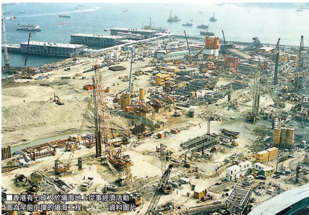
香港有七成人於填海地上從事經濟活動，圖為早前中環的填海工程。資料圖片

團結香港基金副總幹事黃元山則認為，填海不只可解決房屋問題，亦可以減輕交通負荷，集中填海可供應大片平地，完善土地發展及交通配套。