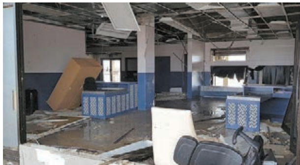
塞班島機場辦公室一片凌亂。

天文台預測，「玉兔」將於本周三(31日)進入本港800公里範圍，由於一股東北季候風的補充同時在本周中期將南下影響香港，屆時「玉兔」進入南海時威力會減弱，或中心附近最高持續風速約每小時175公里，但減弱程度需視乎受季候風補充相互影響而定，呼籲市民密切留意天文台最新天氣消息。