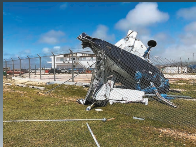
飛機遭強風吹至損毀。