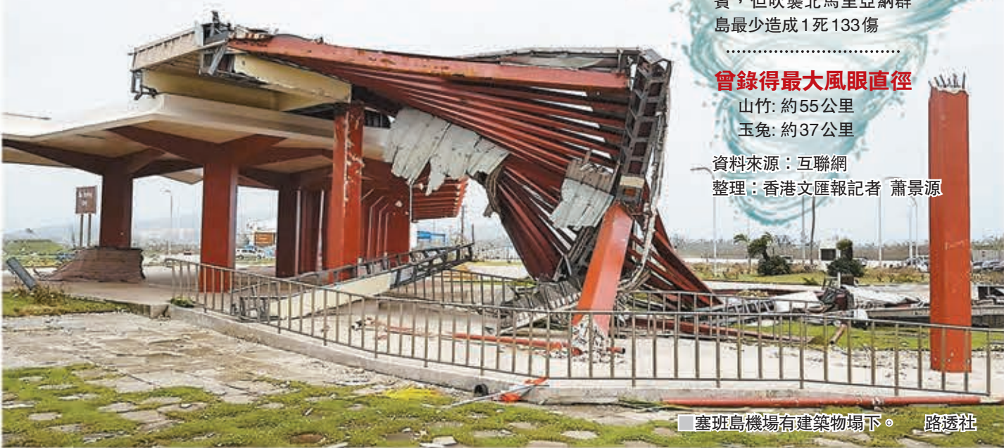
塞班島機場有建築物塌下。