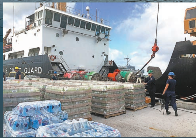
軍方攜同救災物資抵達塞班島。