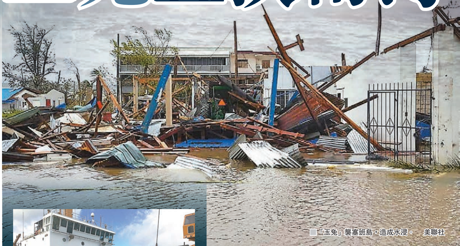
「玉兔」襲塞班島，造成水浸。