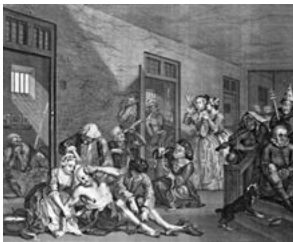
■ 英國畫家威廉·賀加斯的畫作反映了歐洲精神病人被注視。