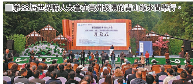
■ 第38屆世界詩人大會在貴州綏陽的高山綠水間舉行。