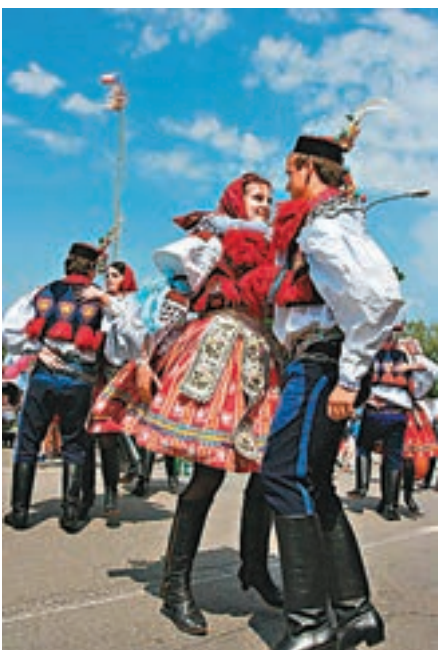
■ 傳統的捷克衣服和舞蹈，慶祝百年歷史。

兩個曾經擁有共同歷史的國家，礦藏豐富，玻璃、啤酒和汽車製造業名聞世界。製鞋業也顯赫，百多年前已研發了