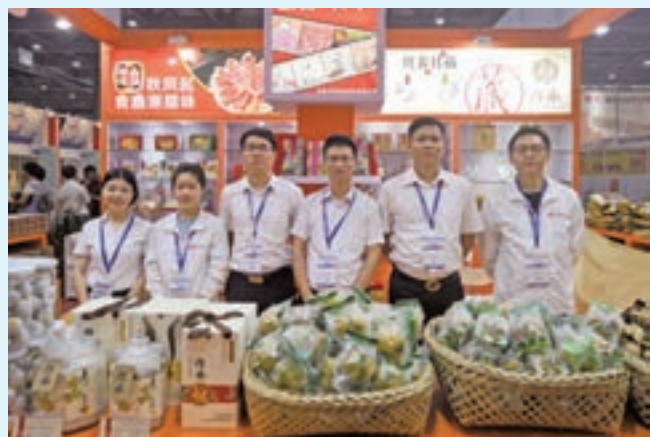
東莞企業參加海絲博覽會獲益良多

在海絲博覽會現場，記者走訪參展的食品企業發現，海絲博覽會積極幫助食品企業「走出去、引進來」，成效顯著：一方面幫助提高食品企業的品牌知名度，開拓「一帶一路」市場；一方面幫助食品企業提供和國際原料供應商對接平台，降低原料採購成本。