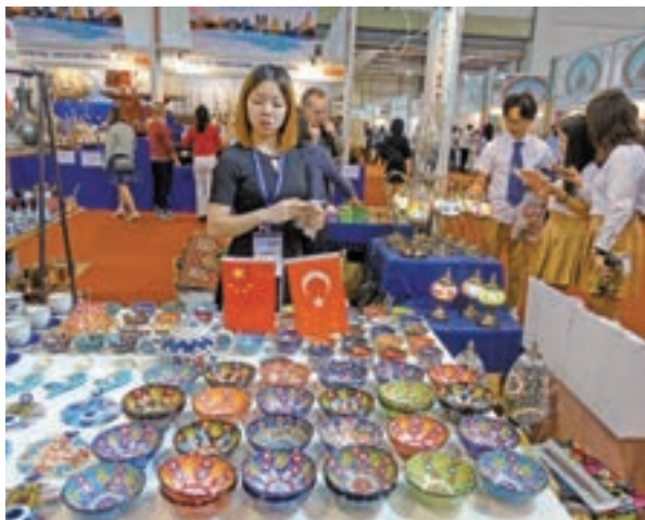
五彩繽紛的陶瓷碗