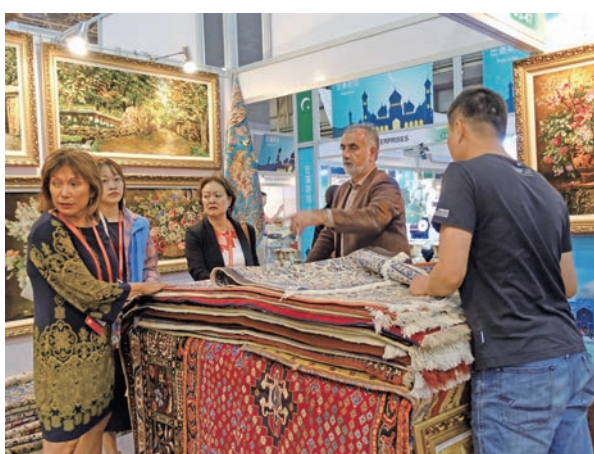
海絲博覽會上的展品琳琅滿目。圖為來自中東地區的地毯

今年的海絲博覽會已經是第五屆，此前4屆共達成簽約項目數2,589個，涉及簽約資金約8,000億元。5年來，海絲博覽會以「做生意、談合作，到廣東」為辦展宗旨，不斷拓展「朋友圈」，參展參會國家從最初的42個拓展到80個，搭建了與沿線國家和地區的經貿合作網絡。很多企業通過海絲博覽會成為了「一帶一路」倡議的受益者，海絲博覽會也已經成為企業「走出去」的助推器。