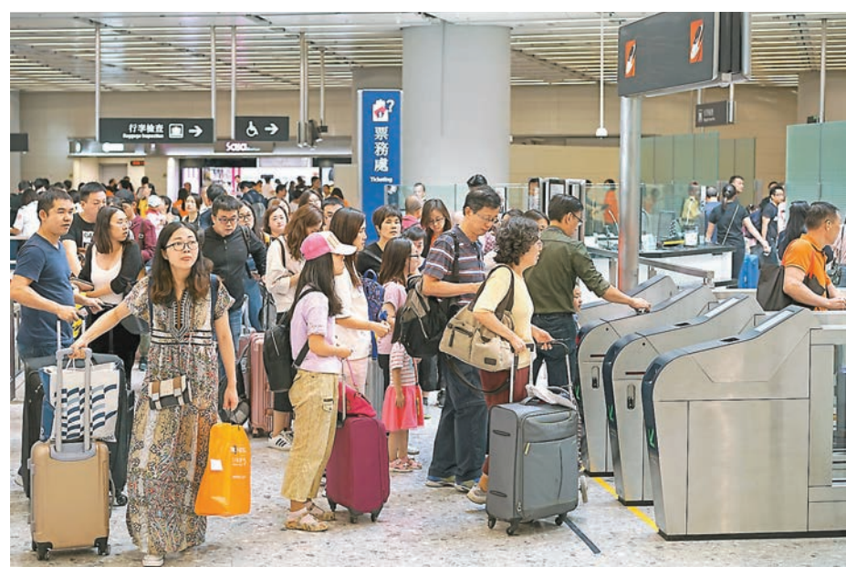
高鐵西九龍站投入服務1個月，已有逾160萬人次通關。

會上問及，高鐵通車後是否曾出現有港方人員誤闖內地口岸區事件。保安局副秘書長丘卓恒透露，過去一個月曾發生一宗港人誤闖內地口岸區事件，涉事者為外判工人。他是在工程期間誤闖內地口岸區，最後被閉路電視發現，執法機關及港鐵已跟