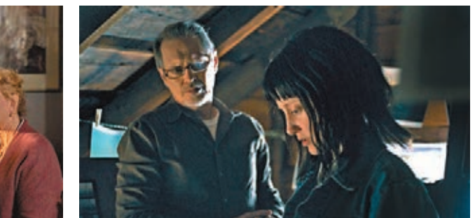
曾演出《鳥人》的安哲雅麗絲洛任女主角。