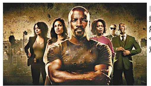
《盧克凱奇》突然停拍，令人大為意外。

事實上Netflix本身就有強勁的劇集陣容，涉獵範圍極廣，即使少了兩套漫威作品也影響有限；也不消提這頻道自行投資拍攝、製作隨時上億美元的頂級電視電影。超級英雄這條水還可吃多久？將成為迪士尼電視生意要面對的問題。除非幕後願意把同屬「老鼠集團」的ABC電視台的口碑出眾劇集《神盾局特工》，搬過去自家串聯頻道獨家播放來吸客。 文：藝能小子