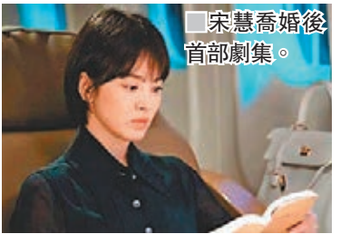
宋慧喬婚後首部劇集。

Look呢？但點都好，憑藉兩人的「朴宋CP」感，會不會令劇集爆紅，再為事業帶來另一個高峰？拭目以待！據悉，《男朋友》將於11月底首播。文：莎莉