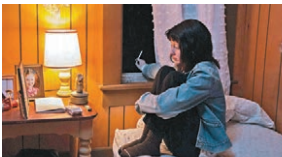
蘭茜終日不得志，內心渴望會有不一樣的人生。