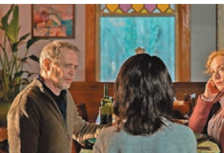
蘭茜深信自己是文學教授夫妻的失散女兒。