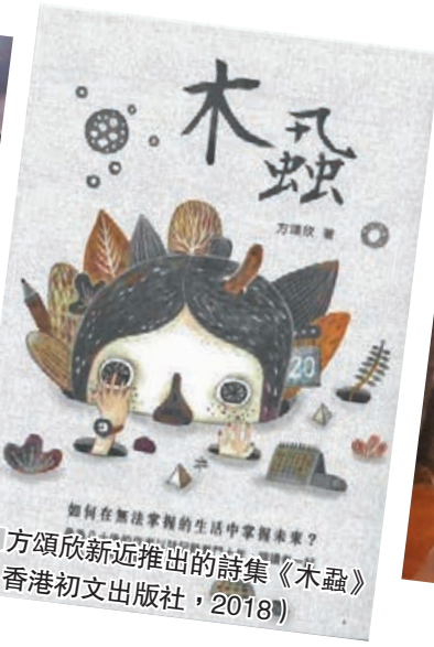
方頌欣最近推出的詩集《木蝨》（香港初文出版社，2018）