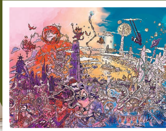
阿推特別為其香港首展創作《捉迷藏》。