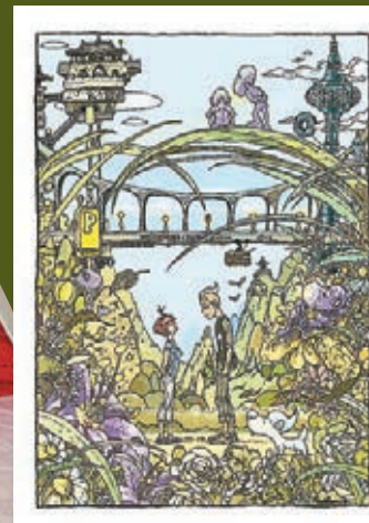
《風竹城》是阿推為家鄉新竹所畫。

看阿推的漫畫，總像在尋寶，就如同今次他在香港首次個展的主題「捉迷藏」一樣，大量的密碼和符號隱藏其中，每次觀賞，都有一次全新的體驗。「阿推的漫畫——捉迷藏」展覽由即日起至11月20日於香港藝術中心三樓實驗畫廊舉行，這是光華新聞文化中心「2018台灣月」的節目之一，也是動漫基地自茂蕪街回歸香港藝術中心後的首個活動，帶領觀眾走入科幻的三次元空間——讓漫畫「捉」動視神經及瘋狂想像，「迷」上其歐美風格與細膩畫法，並收「藏」他的獨特金句、角色和玩具。