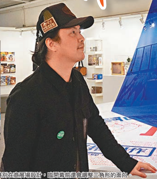
阿推特別在意展覽設計，臨開幕前還會調整三角形的面向。