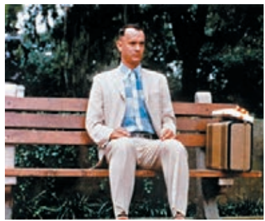
阿甘小時候被女主角喊 run，一個字已經成為句子。

"Now here's Charlie. He's come to the crossroads (十字路). He has chosen a path. It's the right path. It's a path made of principle that leads to character. Let him continue on his journey. You hold this boy's future in your hands, committee. It's a valuable future. Believe me. Don't destroy it. Protect it. Embrace it (擁抱