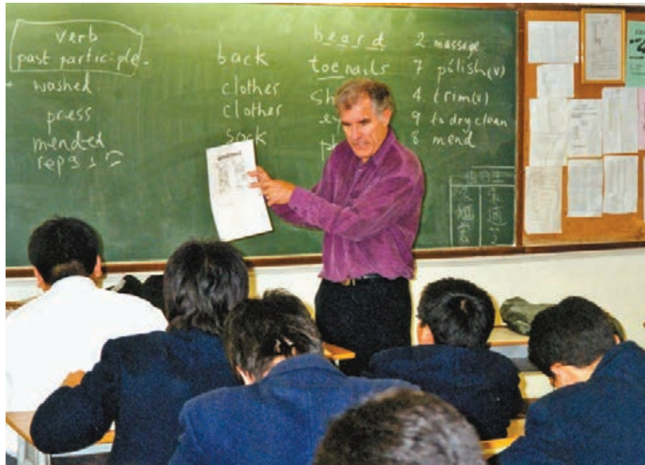
香港學生普遍自小學習英語，但學習方法各有不同。

香港的語言學習環境時刻在變，就正如學習者與學習模式一樣，豐富多彩。學習一種新語言就等於踏進另一個絢麗紛呈的世界，掌握外語的同時更了解自己。