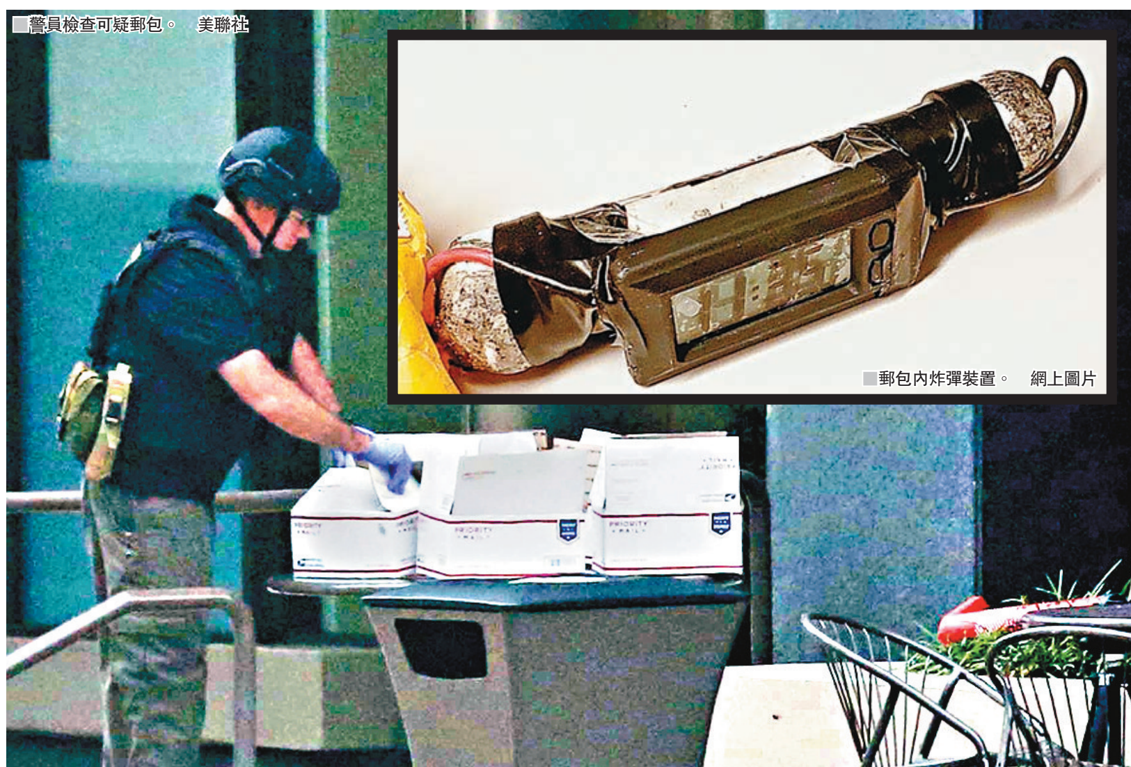
警員檢查可疑郵包。