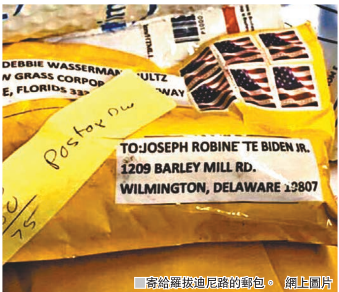
寄給羅拔迪尼路的郵包。

美國民主黨多名政要和美國有線新聞網絡(CNN)近日先後接獲炸彈郵包，繼前總統奧巴馬、前國務卿希拉里後，前副總統拜登、前中情局局長布倫南和荷里活影星羅拔迪尼路等多人亦被人投寄可疑包裹，各包裹內的爆炸裝置屬同款。總統特朗普宣稱譴責政治暴力，呼籲國民團結一致，但同時抨擊傳媒報道假新聞，令社會充滿憤怒。