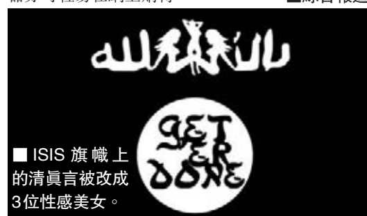
ISIS旗幟上的清真言被改成3位性感美女。