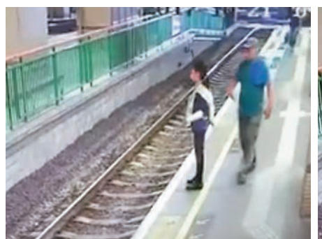
輕鐵元朗總站月台清潔女工去年被男子推落路軌連環圖。

當日負責看守臨時羈留室的警員陳浩文供稱,據其記憶及執勤簽簿紀錄顯示,林拉扯黑色電線期間,他剛往巡查正式羈留室或上廁所,但已通知報案室女同袍代為看管。不過,死因裁判官警告指,錄影片段顯示期間無人巡查過正式羈留室,其證供或會對其構成不利及會遭刑事檢控。陳即選擇不再回答該部分問題,只稱有一次巡倉途中突感肚痛,僅在倉外高呼疑犯名字,聽到對方回應後,便離開趕往廁所。香港文匯報記者 葛婷