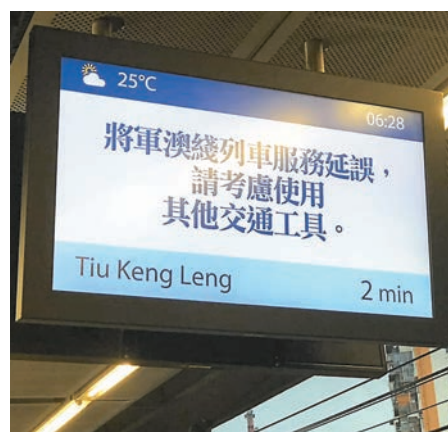
港鐵清晨公佈將軍澳線出現故障,列車服務受到影響。

禍不單行,約同一時間在清晨6時05分,港鐵車務控制中心亦發現觀塘線調景嶺站與油塘站之間出現信號故障,為審慎及安全起見,所有行車在駛經該路段時都要減慢車速,並即時安排工程人員搶修。