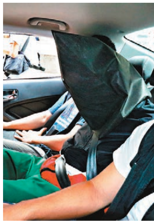
商業罪案調查科人員將倫敦金騙案其中一名騙徒押回警署調查。