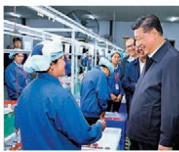
習近平在英德市連江口鎮連樟村扶貧玩具加工廠了解當地脫貧情況。

「產業扶貧是最直接、最有效的辦法，也是增強貧困地區造血功能、幫助群眾就地就業的長遠之計。要加強產業扶貧項目規劃，引導和推動更多產業項目落戶貧困地區。」