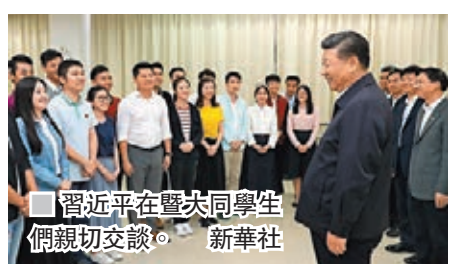
習近平在暨大與同學們親切交談。新華社

「我國有5,000多萬海外僑胞，這是我國發展的一個獨特優勢。改革開放有海外僑胞的一份功勞。希望暨南大學認真貫徹全國教育大會精神，堅持自己的辦學特色，把學校辦得更好，為海外僑胞回祖國學習、傳承中華文化創造更好條件。」