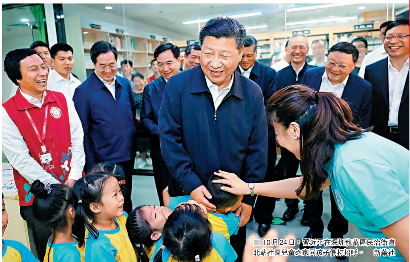
10月24日，習近平在深圳龍華區民治街道北站社區兒童之家同孩子們打招呼。

四是 加強黨的領導和黨的建設 。要牢固樹立「四個意識」，堅定「四个自信」，堅決維護黨中央權威和集中統一領導。要嚴明政治紀律和政治規矩，落實新形勢下黨內政治生活若干準則，涵養風清氣正的政治生態。要堅持正確選人用人導向，建設忠誠乾淨擔當的高素質專業化幹部隊伍。要繼續推進作風建設，整治各種隱形變異「四風」問題，防範商品交換原則向黨內滲透，規範政商交往行為，加快構建親清新型政商關係。