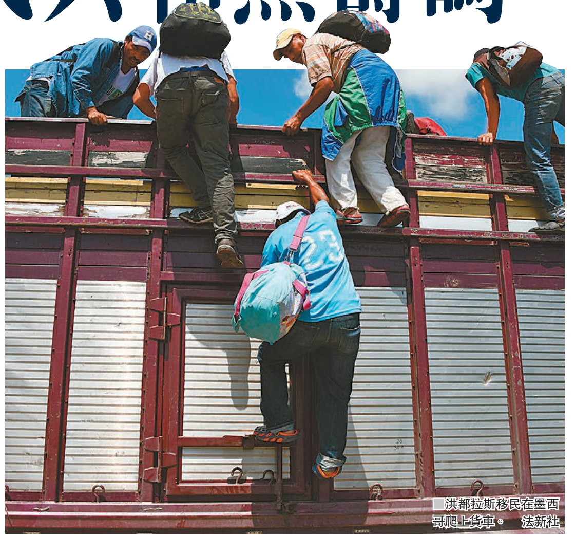
洪都拉斯移民在墨西哥爬上貨車。