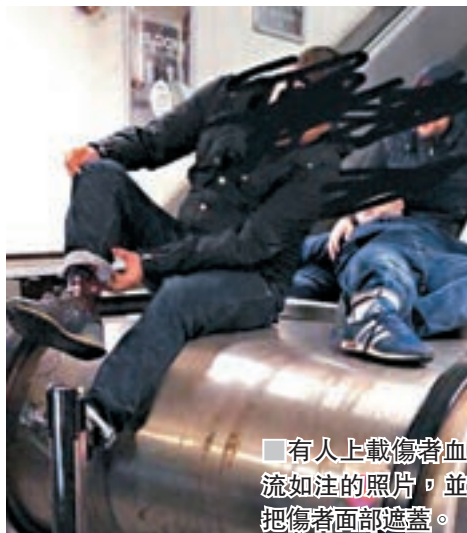
有人上載傷者血流如注的照片，並把傷者面部遮蓋。