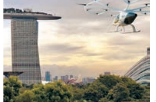
新加坡空中的士模擬圖

Volocopter表示，明年的試飛，主要是測試飛天的士在不同環境的性能，將在新加坡成立產品設計和工程團隊，並與新加坡民航局合作，決定試飛規模，以及是否需由機師操控飛天的士等。Volocopter又透露正與多個城市磋商，可能在未來3至5年開設首條商營飛天的士路線。 ■綜合報道