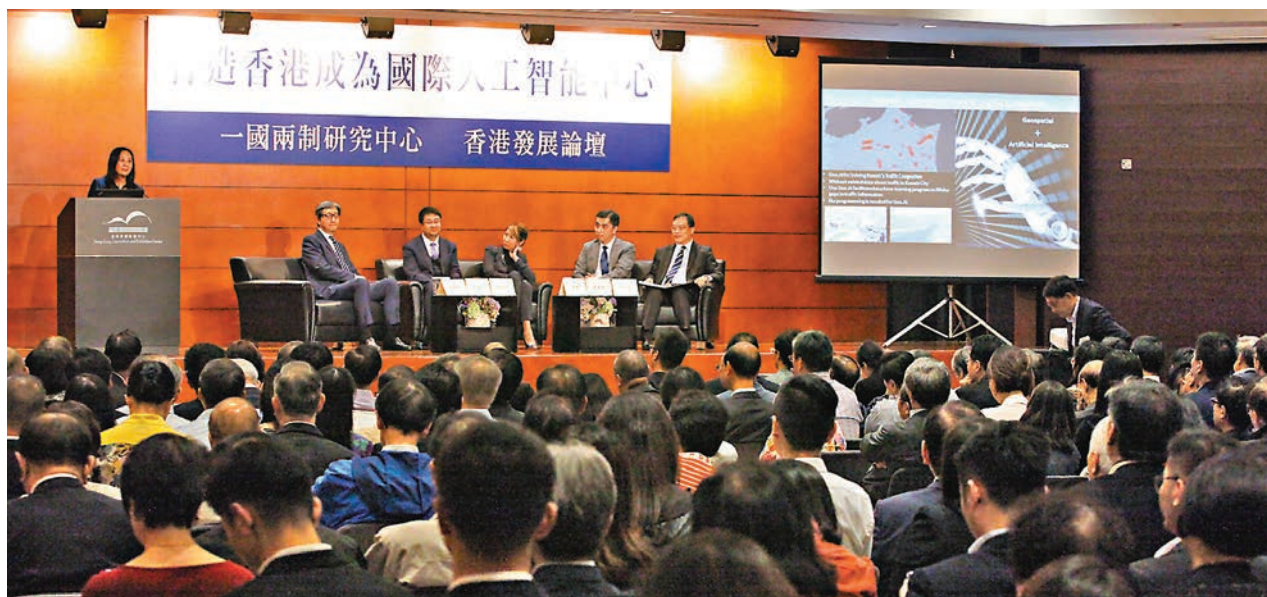
「一國兩制」研究中心及香港發展論壇舉辦「打造香港成為國際人工智能中心」研討會。

她指出，現時AI商品化進入高速期，以前一個AI項目商品化可能要十年八載，如今只需十月八月。她指AI界有兩大語系，一個是以美國為首的英語系統，一個是中國為首的中文系