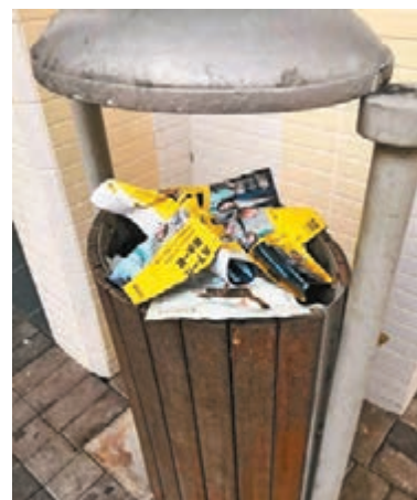
邨內垃圾桶塞滿李卓人的宣傳單張。