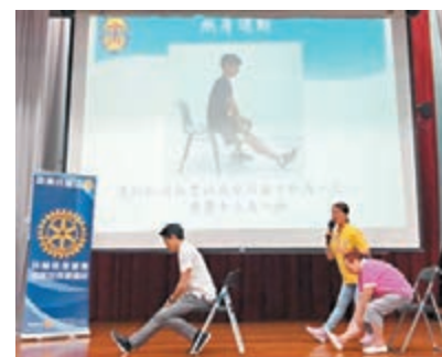
「社區驗血糖計劃」昨日於牛頭角舉行。