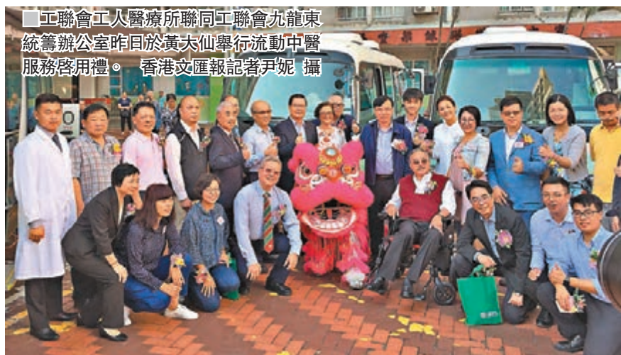
工聯會工人醫療所聯同工聯會九龍東統籌辦公室昨日於黃大仙舉行流動中醫服務啟用禮。

工聯會工人醫療所行政秘書黃遠歡向香港文匯報記者指，新一部醫療車在8月初投入服務，每日約服務30人至40人，多