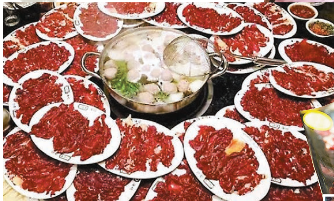
潮汕美食聲名在外，講究刀工和火候的潮汕火鍋，不同部位的牛肉都有自己的黃金享用時間。