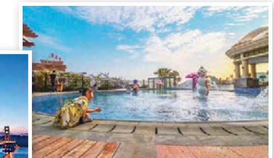
汕頭南澳島新開酒店，主推海水恆溫浴場。

價格實惠的汕頭喜來登，當然是市區住宿的首選。而今年上半年才開業的南澳島海島灣酒店，不僅擁有現在「網紅」酒店的一切硬件設施，其中恒溫海水療浴更是它得天獨厚的地理優勢。值得一提的是，兒童泳池也