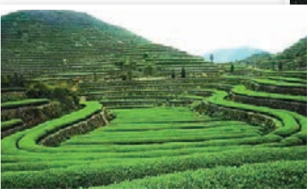
京明溫泉度假村內的茶園可享茶山清香。

此外，憑借「普寧豆乾」走出的揭陽普寧，也擁有一些旅行度假村。其中，溫泉也是該地的主打特色。當地人都熟悉的盤龍灣溫泉度假村，便是位於普寧市梅林盤龍自然