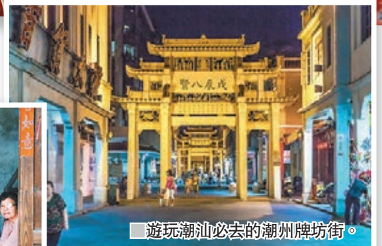
遊玩潮汕必去的潮州牌坊街。