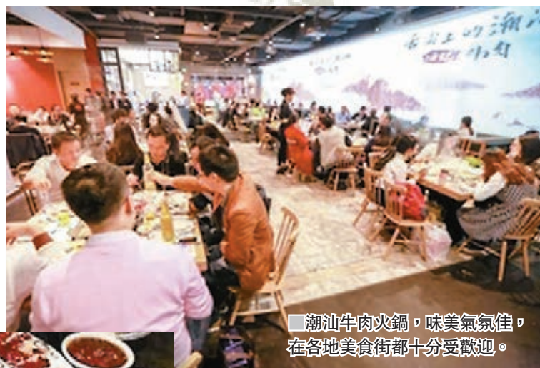
潮汕牛肉火鍋，味美氣氛佳，在各地美食街都十分受歡迎。

天氣一凍，打邊爐和溫泉最先被人想起。被譽為「與時間賽跑」的潮汕牛肉邊爐，人氣居高不下。如今，從本港到潮州每日至少5個班次的高鐵，3小時內即達。高鐵到站，遊客即可品嚐牛肉邊爐、滷水鵝、街頭巷尾各類小食以及入住一晚溫泉酒店，過一個暖和的冬天。值得一提的是，從潮汕高鐵站出發，到潮州、汕頭、揭陽三市時間都是30分鐘左右，任君選擇。 ■香港文匯報記者胡若璋 廣州報道