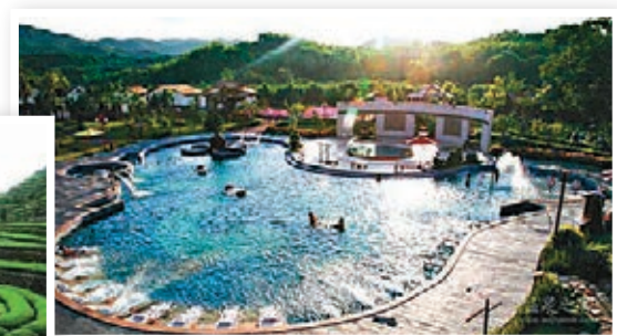
揭陽盤龍灣溫泉度假村

潮汕美食多，吃牛肉更是專一而細緻的講究，只需一鍋清湯水煮熟開，鮮美無比。能讓本地人都排隊的金記鮮活牛肉城，憑