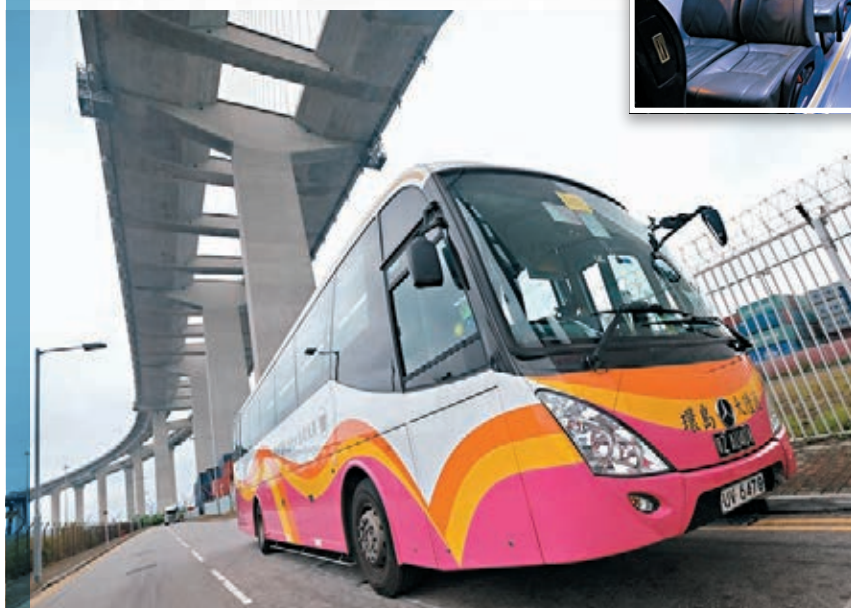
環島大陸通巴士行走港珠澳大橋。