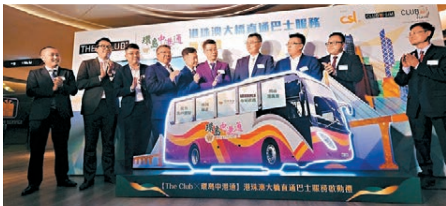
「環島中港通」昨日舉行港珠澳大橋直通巴士服務啟動禮。

月底或下月初可正式營運。該公司已為提供服務籌備很長時間，無論買車、招聘司機、安排銷售等均已做好準備，開通首日港澳快線62班車可全數提供，粵港線則可提供七八成運力，預計一個月內可以百分之百投入服務。