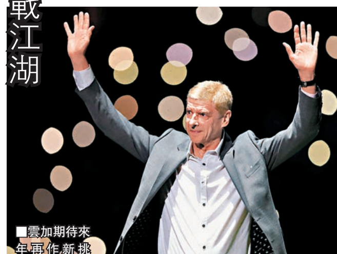
■雲加期待來年再作新挑戰。路透社