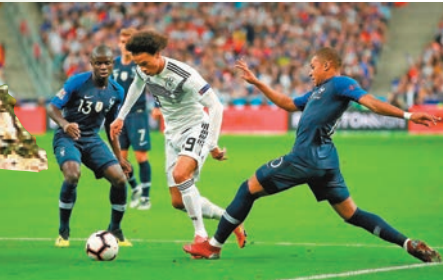
■辛尼(中)強行突破，簡迪(左)和麥巴比夾擊。