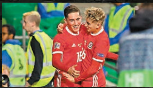
■哈利威爾遜(左)一箭定江山。

雖然缺少艾朗藍斯及加里夫巴利兩大主力，不過威爾斯憑藉新星哈利威爾遜一記百步穿楊的罰球，仍能1:0作客力挫愛爾蘭取得寶貴3分，壓過丹麥升上歐國盃B級賽第4組榜首，有望升班。由利物浦外借至打比郡的翼鋒哈利威爾遜不負眾望，下半場主射罰球破網。威爾斯主帥傑斯對這位年僅21歲的新星讚不絕口，甚至將他與昔日曼聯戰友、「黃金右腳」碧咸相提並論：「哈利威爾遜有特別的天分，我看碧咸的罰球很多年，那全是練習得來的成果，而哈利也是一樣。」