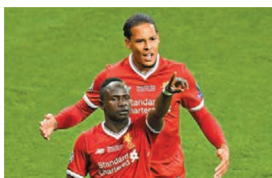
■利物浦包括文尼(左)跟雲迪積克的四員主將都帶傷歸隊。