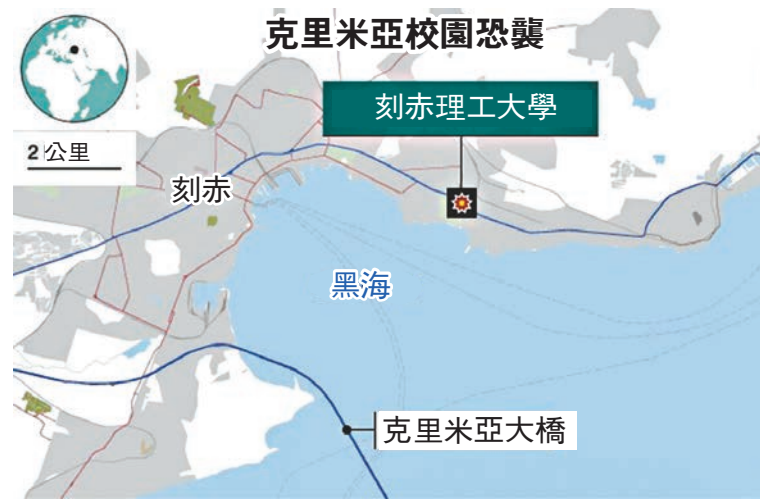
克里米亞校園恐襲