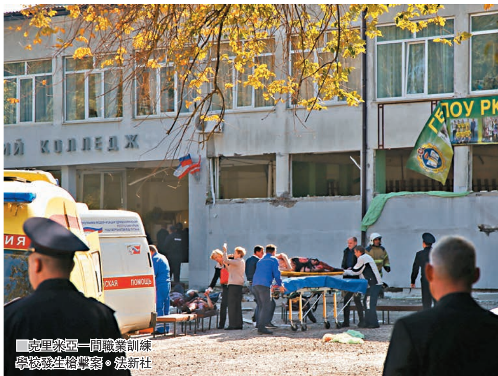
克里米亞一間職業訓練學校發生槍擊案。