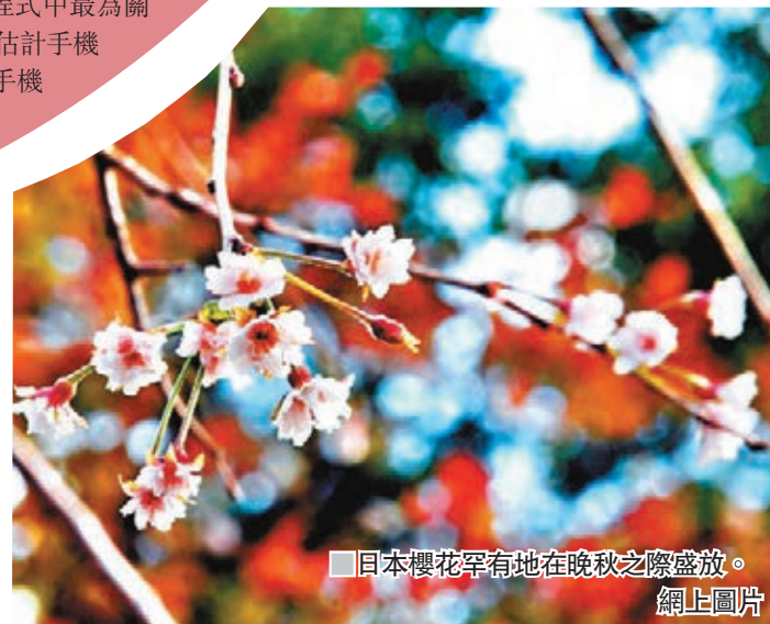
日本櫻花罕有地在晚秋之際盛放。網上圖片