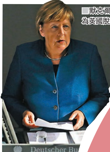
默克爾表示，德國已開始為英國脫歐作準備。