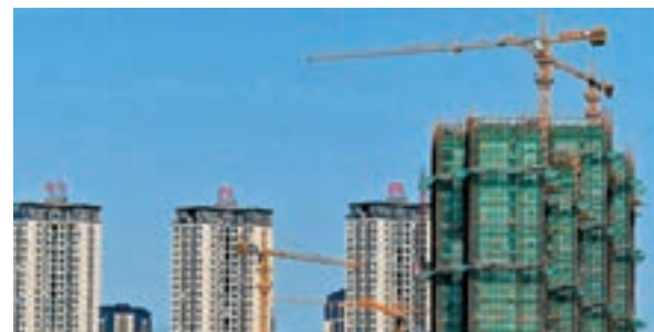
房地產是上榜女富豪主要財富來源。 資料圖片

香港文匯報訊(記者 孔愛瓊 上海報道)據昨日發佈的2018胡潤女富豪榜顯示,全球最成功的女企業家中國佔比超6成,其中碧桂园的楊惠妍以1,500億元(人民幣,下同)財富蟬聯中國女首富。