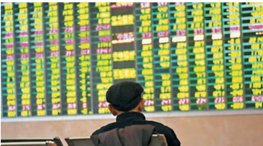
滬深股市三大指數近日表現疲軟,不少分析擔憂,質押風險將令A股進一步受壓。

香港文匯報訊(記者 章蘿蘭、蔡競文)A股跌跌不休,不僅散戶損失慘重,股權質押風險亦隨之高漲。彭博匯總的數據顯示,今年以來至少有45家A股上市公司被質押的股份遭券商強平,其中6月份以來有35家,為前五個月總和的逾三倍。截至10月12日,有61家公司的質押率超過60%,其中有38隻股票今年至今下跌超過40%,其中跌幅最大的達到77%。不少分析擔憂,質押風險將令創業板進一步暴跌,A股恐已出現流動性危機。