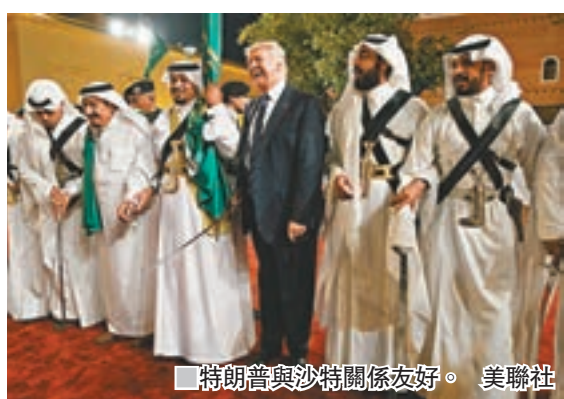
特朗普與沙特關係友好。