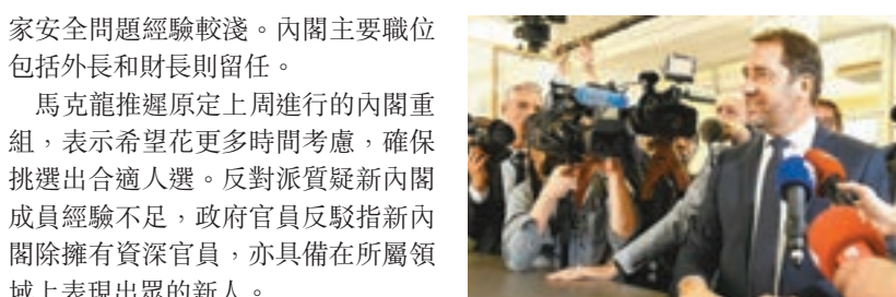
家安全問題經驗較淺。內閣主要職位包括外長和財長則留任。 馬克龍推遲原定上週進行的內閣重組，表示希望花更多時間考慮，確保挑選出合適人選。反對派質疑新內閣成員經驗不足，政府官員反駁指新內閣除擁有資深官員，亦具備在屬領域上表現出眾的新人。

馬克龍政府近期先後有3名閣員請辭，民望不斷下滑，馬克龍決定重組內閣。52歲的卡斯塔內是馬克龍核心圈子的重要人物，但對政府管治及國