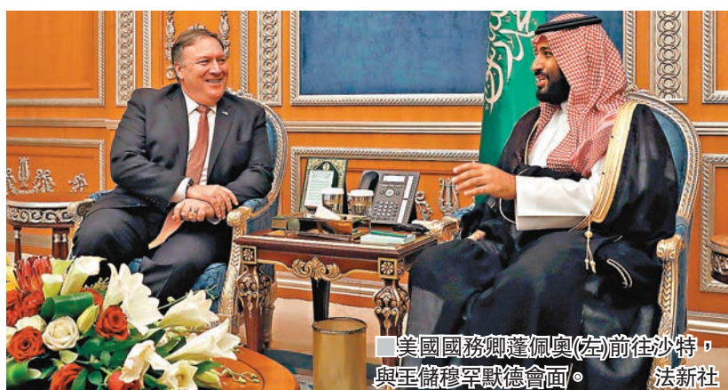
美國國務卿蓬佩奧(左)前往沙特，與王儲穆罕默德會面。

沙特國營油企沙特阿美本月初公佈，將跟隨布蘭特期油價格，上調向東亞及地中海地區客戶提供石油的價格，分別調高70%及30%，但向美國出口的石油價格則維持不變。沙特阿美代表被問及背後原因時，表示是「給予特朗普的訊息」，對特朗普要求沙特遏抑油價作出回應，強調沙特不希望利用油價作為武器。國際油價