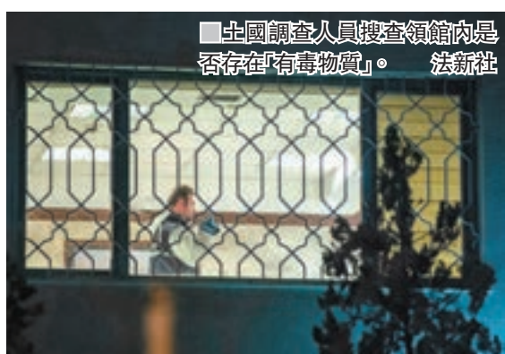
土國調查人員搜查領館內是否存有「有毒物質」。

由於土耳其連日來透露不少有關卡舒吉失蹤案的細節，令外界相信土耳其政府知悉事情真相，並掌握相關證據。曾在卡舒吉失蹤前一日與他午膳的朋友塔米米表示，特朗普的「流氓殺手」論，將損害土耳其總統埃爾多安的公信力。 ■綜合報道