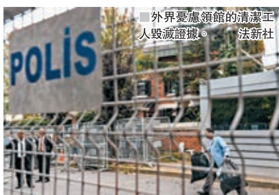
外界憂慮領館的清潔工人毀滅證據。