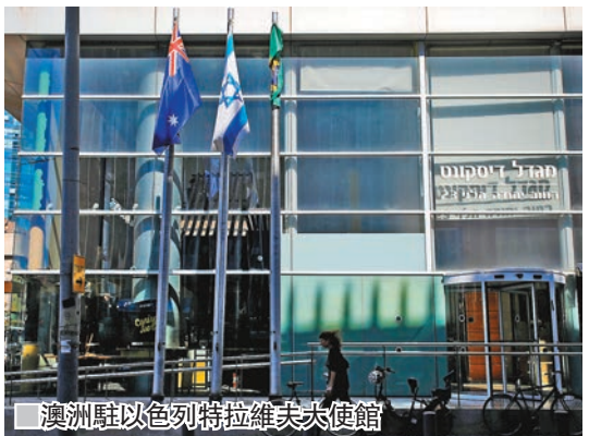
澳洲駐以色列特拉維夫大使館

的提案，澳洲將投下反對票。 前總理特恩布爾8月被逼宮下台後，他隸屬的文特沃恩選區議員將於周六補選。反對黨工黨批評莫里森為勝選選舉，不惜扭轉澳洲外交政策。工黨議員黃英賢指出，無論文特沃恩或澳洲人民，均應由一位以國家安全及長期利益為重的政治人物領導。 ■美聯社/路透社