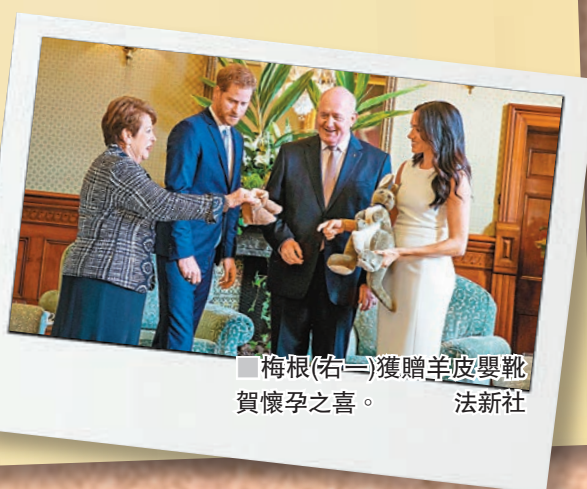
梅根(右二)獲贈羊皮嬰靴賀懷孕之喜。

哈里夫婦隨後到動物園觀賞樹熊，再乘船遊覽悉尼港口，數以千計群眾聚集在悉尼歌劇院外，揮舞澳洲國旗及哈里夫婦照片，爭睹兩人風采。哈里夫婦與在場群眾握手聊天，梅根身穿一套白色緊身長裙，身形窈窕，興奮地接受群眾送上的花束和祝福卡。 ■綜合報道