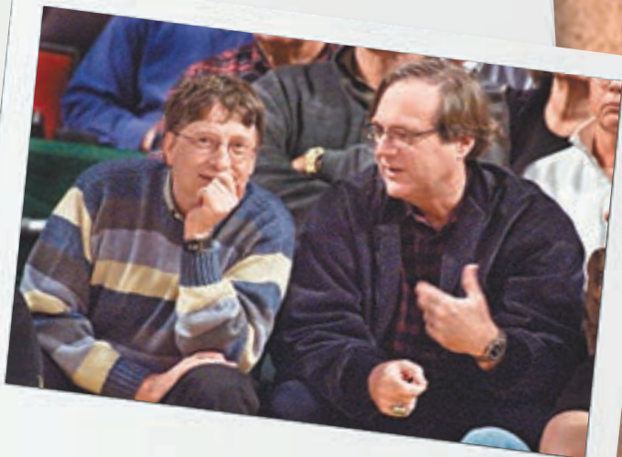
蓋茨(左)指艾倫是他相識最久和最親密的朋友。圖為2003年二人合照。