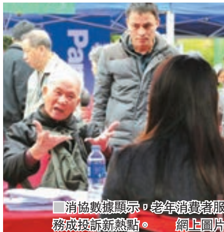
消協數據顯示,老年消費者服務成投訴新熱點。

香港文匯報訊 據中新社報道,中國消費者協會(以下簡稱「消協」)昨日發佈消息稱,2018年第三季度全國消協組織共受理消費者投訴19.8萬餘件,其中售後相關投訴居多,老年消費者服務成投訴新熱點。