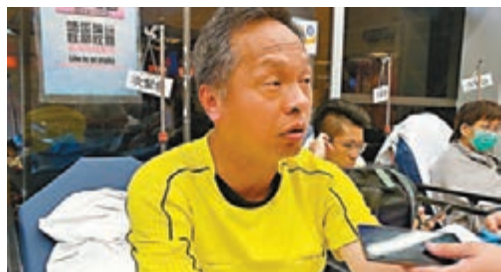
被毆傷球證在醫院聲言不會縱容球場暴力。