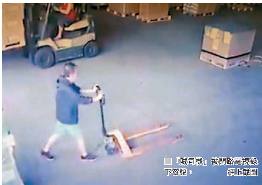
「賊司機」被閉路電視錄下容貌。

香港文匯報訊(記者 蕭景源)「假司機,真竊賊!」狡賊應徵貨車司機首天上班即盜貨棄車。一名疑有數宗同類案件前科、包括去年一宗涉及1,300萬元電子零件盜竊案,被警方通知運輸業界通緝的男子,消失一年多後又再犯案,前日早上在落馬洲一間運輸公司首天上班,即連車帶貨偷去無蹤。警方當晚尋回貨車,惟車內一批總值近155萬元的手機和手提電腦已不知所終,警方重案組已接手設法追捕疑犯及失物下落。中伏的運輸公司則批評警方只向部分運輸業聯會公開積犯資料及犯案手法,令他們無從提防而遭致損失。