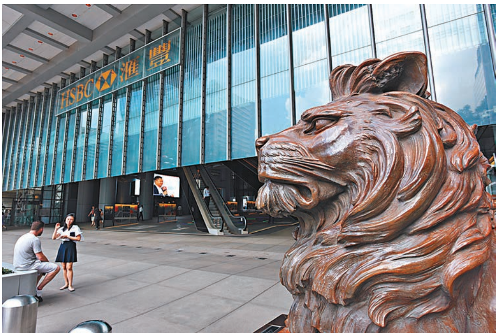
匯豐認為，擁有匯率彈性、合適的外匯儲備水平、資本賬繼續開放以及人民幣加快國際化，均符合中國的利益。

該行相信，內地將會容許人民幣跟隨經濟理論和市場節奏而走軌，但同時準備好遏制快速變動和過度貶值。內地有多種工具作出調控，包括出售外匯儲備和鼓勵外資的長期資產配置。匯豐認為，內地不會利用人民幣過弱勢作為報復，但亦不會同意把人民幣釘在不合理的強勢水平。該行相信，擁有匯率彈性、合適的外匯儲備水平、資本賬繼續開放以及人民幣加快國際化，均符合中國的利益。在