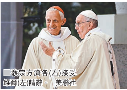
教宗方濟各(右)接受維爾(左)請辭。

教廷未有提名替補人選，維爾會暫時留任，直至新主教上任為止。維爾表示希望他辭職後，天主教會能向前走，他就昔日的錯誤再次道歉並尋求寬恕。有教會性侵犯受害者坦言對方濟各的態度失望，強調維爾是犯嚴重過失。 ■綜合報道