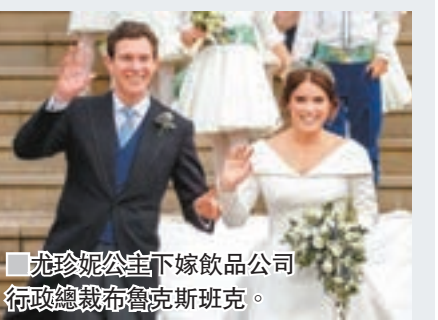
尤珍妮公主下嫁飲品公司行政總裁布魯克斯班克。