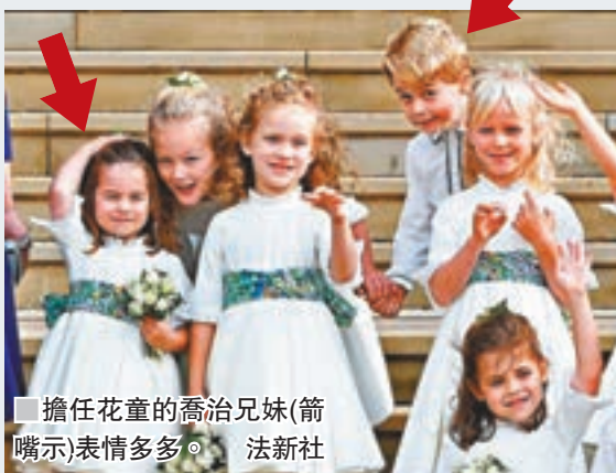
擔任花童的喬治兄妹(箭頭)表情多多。

婚禮在溫莎堡聖喬治教堂舉行，約850名賓客出席。擔任花童的喬治小王子和夏洛特小公主表現可愛非常搶鏡，尤其夏洛特冒著大風步上教堂階梯時，還向在場群眾微笑揮手。 ■綜合報道