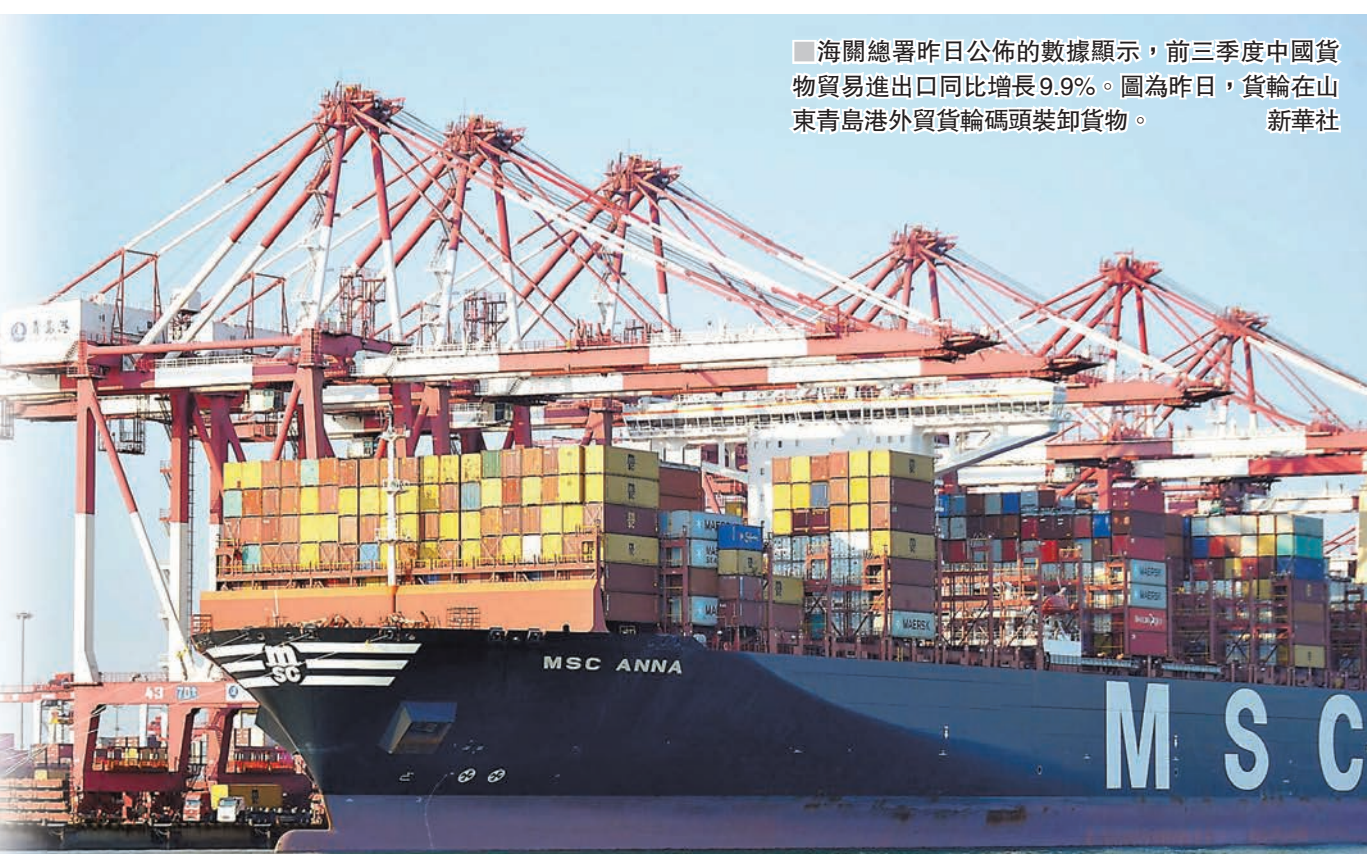
海關總署昨日公佈的數據顯示，前三季度中國貨物貿易進出口同比增長9.9%。圖為昨日，貨輪在山東青島港外貨輪碼頭裝卸貨物。

據海關統計，前三季度，中國貨物貿易進出口總值22.28萬億元，比去年同期增長9.9%。其中，出口11.86萬億元，增長6.5%，進口10.42萬億元，增長14.1%；貿易順差1.44萬億元，收窄28.3%。按季度看，前三季度，中國進出口總值逐季提升，分別為6.76萬億元、7.35萬億元和8.17萬億元，增長9.4%、6.4%和13.8%。