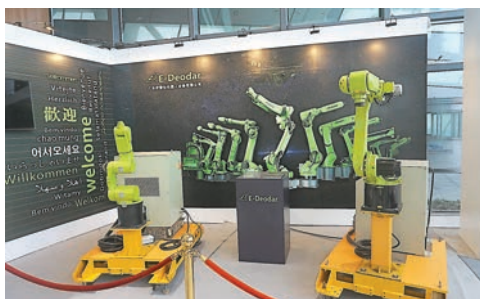
半導體芯片是人工智能產品的核心。