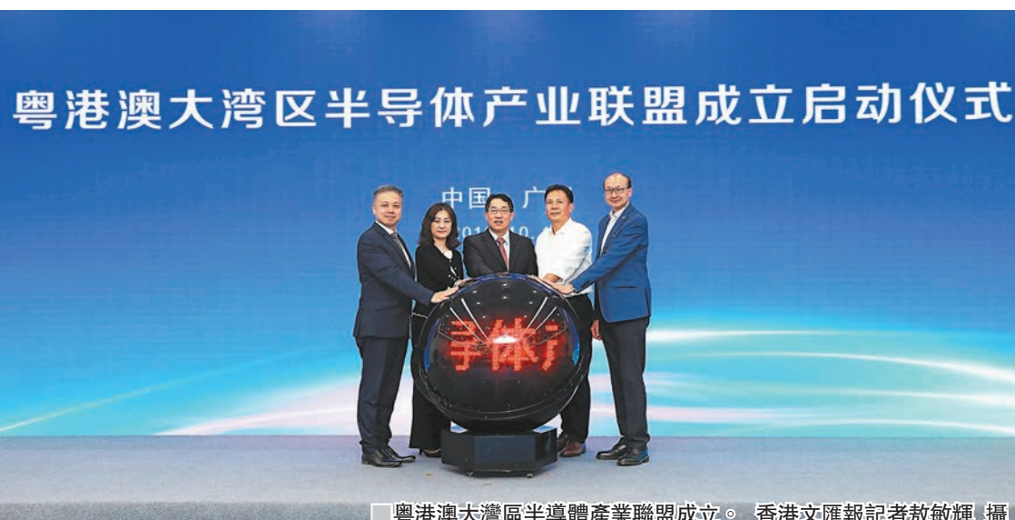
粵港澳大灣區半導體產業聯盟成立。

廣州粵芯半導體技術有限公司成立不足一年，項目總投資已達70億元人民幣。香港文匯報記者了解到，粵芯12寸芯片項目主要生產微控制器、電源管理、功率分立器件等模擬芯片產品，可滿足物聯網、汽車電子、人工智能、5G等創新應用需求。自項目落戶以來，已吸引設計、封裝、測試領域的22家關聯企業入駐價值創新園，集羣效應初顯。