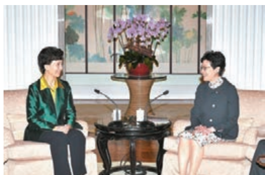
林鄭月娥(右)與譚貽琴會面。

林鄭月娥表示，貴州資源豐富，近年發展迅速，增長潛力優厚；而香港是貴州外資第一大來源地，亦是為貴州將國外投資者「引進來」和協助貴州企業「走出去」的重要平台。她說，隨着廣深港高鐵路港段上月開通，從香港西九龍站到貴陽北站只需五個多小時，對促進兩地進一步合作十分有利。其中，貴州省致力發展大數據產業，成績斐然；而香港正積極推進新科技發展，包括生物醫藥、人工智能和智慧城市，她期望兩地在相關範疇開拓更多合作空間。