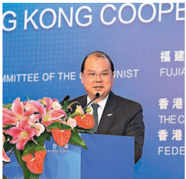
張建宗於2018閩港合作推介會上致辭。

香港文匯報訊(記者 周曉菁)廣深港高鐵路港段已開通兩個多星期，不少市民都前去體驗動感號。政務司司長張建宗昨日出席一個公開活動時透露，下月17日他將率領香港政府代表團乘坐高鐵路前往福建福州，出席第三次「閩港合作會議」。他笑稱：「我相信我們是首個坐高鐵到福建公幹的香港特區政府代表。」