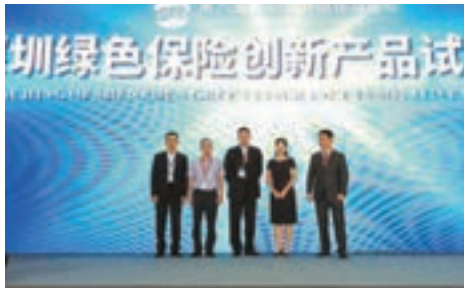
■平保推出綠色保險產品。

在此次博覽會上，深圳市福田區人民政府、中國平安財產保險股份有限公司深圳分公司、深圳市經濟特區金融協會綠色金融專業委員會共同啟動「深圳綠色保險創新產品試點」儀式，推出了綠色保險產品，房間甲醛過多可以獲得保險賠付。