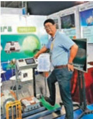
■鋼集團等青睞。風發科技推出的節能電機受到青