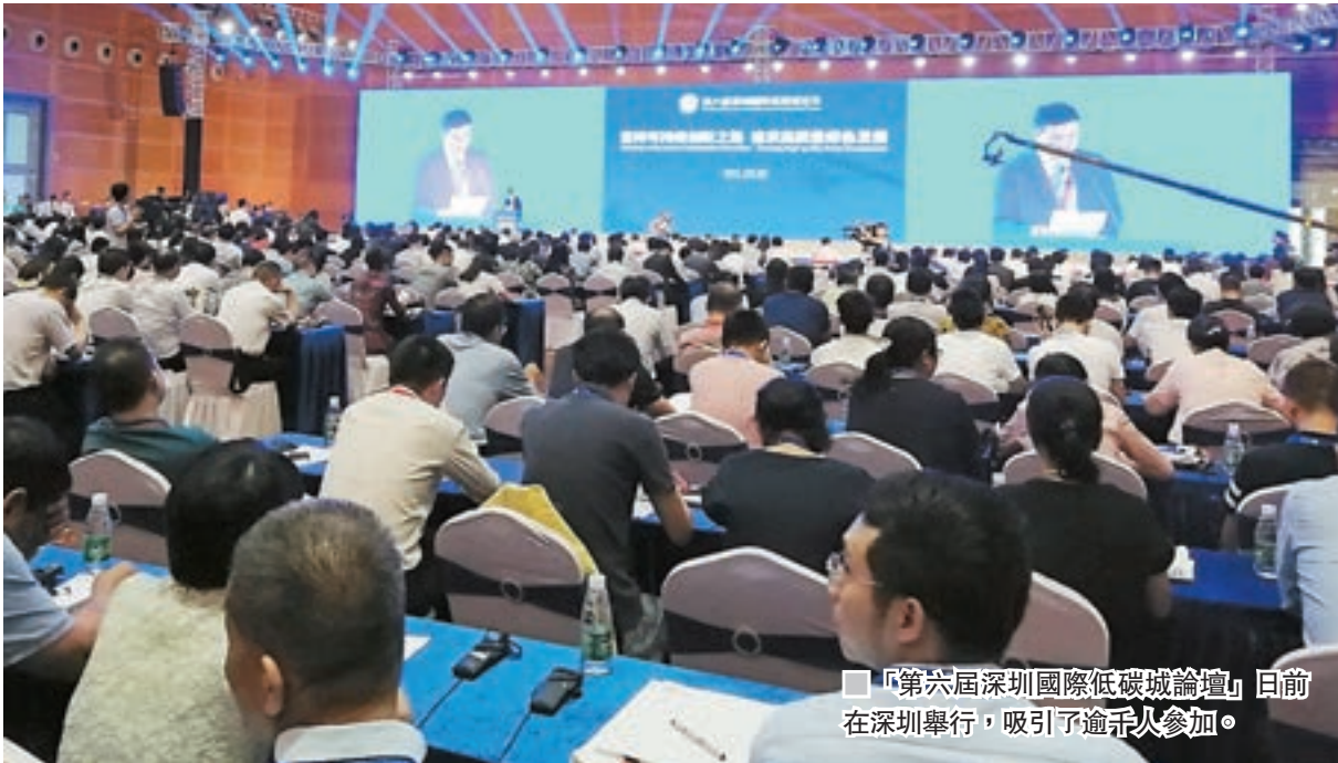
■「第六屆深圳國際低碳城論壇」日前在深圳舉行，吸引了逾千人參加。

早在2016年底，國務院印發《「十三五」國家戰略性新興產業發展規劃》，《規劃》要求把握全球能源變革發展趨勢和內地產業綠色轉型發展，着眼生態文明建設和應對氣候變化，以綠色低碳技術創新和應用為重點，引導綠色消費，推廣綠色產品，大幅提升新能源汽車和新能源的應用比例，全面推進高效節能、先進環保和資源循環利用產業體系建設，推動新能源汽車、新能源和節能環保等綠色低碳產業成為支柱產業，到2020年，產值規模達到10萬億元以上。