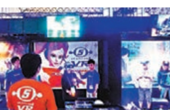
PS繼續推廣VR，主打節拍遊戲《Space Channel 5》。