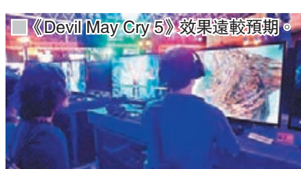
《Devil May Cry 5》效果遠較預期。的原版優勝。已在港發售的《街霸》和橫向動作打鬥合輯也不乏捧場客。

這幾年Capcom都是TGS的台柱，無他，因為有《Monster Hunter》新作壓陣，但今年並沒有「芒芒」，而是靠喪屍恐怖遊戲《Biohazard 2》重製版與型男狂砍惡魔的《Devil May Cry 5》，結果同樣都塞滿機迷去排隊試玩。尤其是《DMC5》，畫面表現效果和操作爽快感都很出色，比前作優秀不少，料可成爲明年3月的大賣作品；《Bio2》更比20年前