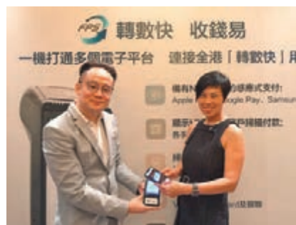
HKT連接轉數快，提供一站式「智能POS」流動收款服務。

近年，流動支付流行，進而發展至流動收款。早前，HKT Payment宣佈旗下Tap & Go拍住賞，透過由香港金融管理局推出的「轉數快」，爲客戶及商戶提供更靈活及方便的即時資金轉賬及流動收款服務。