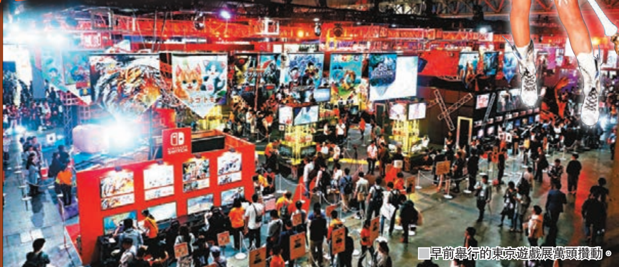
早前舉行的東京遊戲展萬頭攢動。

於亞洲最具規模、歷史最悠久的電玩展覽「東京遊戲展」(TGS)，今年已踏入第23個年頭，隨着流行玩意從家用機、手提機和手機轉移到電競(eSports)與虛擬實境(VR)等相對較新穎類型，記者早前走訪發現，場內很多受注目展品都是這些新東西，時刻都人頭湧湧。難怪連當地新聞節目都揚言，今屆遊戲展主角正是電競和VR！ 文、攝：電能小子