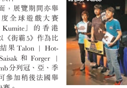
HotDog29(中)脫穎而出取得赴法國作賽入場券。