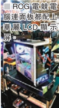
邊打機邊踏單車，不用擔心手脚運動量不平衡。 ROG 電競電腦連面板都配上華麗LCD顯示屏。

早前在香港電競節動作甚多的ROG和MSI等廠，今年也有在TGS擺檔，展出各種電競配件及高階電腦，其中ROG的主機機箱還配備LCD屏幕，為冷冰冰的機箱添上新鮮感。