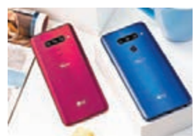
LG V40 ThinQ背後有三個鏡頭，連前鏡頭，共五鏡頭。

日前，LG電子宣佈推出全新旗艦智能手機V40 ThinQ，突破性配備五個相機鏡頭，呈獻全新的手機攝影體驗。它貫徹旗艦V系列的设计理念，除了配備6.4吋Full-Vision OLED屏幕，亦採用比以往更纖窄的邊框，帶來更好的手感及視覺體驗。全新V40 ThinQ採用Qualcomm Snapdragon 845處理器，內置6GB RAM/64GB或128GB ROM記憶體，繼續保留廣受歡迎的V系列特色設計。