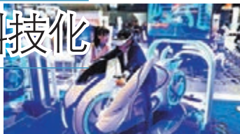
猶像《電子世界爭霸戰》的VR電單車，甚具霸氣。

VR與其衍生物AR(擴張實境)及MR(混合實境)，技術發展一日千里，但礙於要感受到最傳神的虛擬體驗，安坐家中較難辦到，所以會場內展出的多屬大型裝置，大方向是吸引遊樂場或VR Park等引入，作為遊人逐次付費或按時收費的新紀元娛樂方式。像JPPVR VRES攤位便擺放十多台搶眼發光的機器，有跑車、電單車、炮台甚至機械蜘蛛等，無論遊戲體驗抑或觀感都與單純戴上VR頭罩絕不相同，而能容納這種規模都只限於遊樂場等地方。而且，亦有廠商大推VR恐怖遊戲及VR購物體驗，務求把VR應用推給更多受眾享用。PS亦不致怠慢，繼續在PS-VR方面推陳出新。