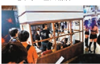
在狹窄視域內，玩恐怖遊戲會有更震懼的效果。