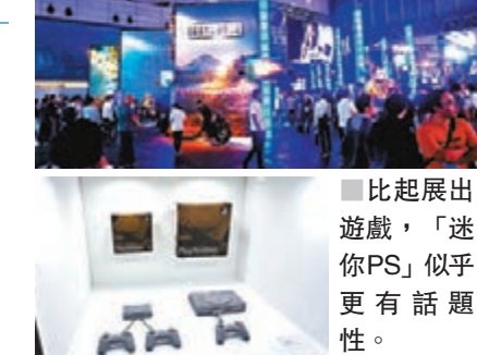
此外，SIE亦在TGS發表「迷你PS」，收錄《Wild Arms》等20款PS經典名作，將於12月3日推出。