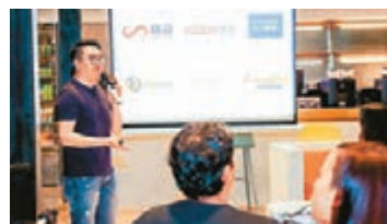
香港科創團隊分享香港創業生態和發展機遇。

為吸引與服務粵港澳青年創新創業,由三地資金、人才合作開發位於珠海橫琴的粵澳雙創中心,將進一步促進大灣區人才交流融