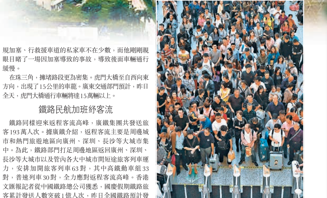
國慶長假臨近尾聲,多地迎來返程客流高峰。圖為旅客昨日在杭州火車東站候車大廳等待檢票上車。新華社

規加塞、行救援車道的私家車不在少數,而他剛剛親眼目睹了一場因加塞導致事故,導致後面車輛通行緩慢。 在珠三角,擁堵路段更為密集。虎門大橋至自西向東方向,出現了15公里的車龍。廣東交通部門預計,昨日全天,虎門大橋通行車輛將達15萬輛以上。