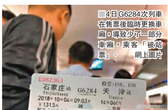
4日G6284次列車在售票後臨時更換車廂,導致少了一部分車廂,乘客「被站票」。

香港文匯報訊 據中新網報道,網友日前爆料,4日G6284次列車和5日G6288次列車在售票後臨時更換車廂,導致少了一部分車廂,乘客「被站票」。昨天下午,北京鐵路局對此事進行了回應。北京鐵路局透露,國慶假期,上次列車由平日的短編組改為重聯長編組運行,4日因重聯動車組中的一組發生故障,臨時安排短編組運行。目前,列車已經恢復重聯運行。由此給旅客帶來的不便,鐵路部門深表歉意。