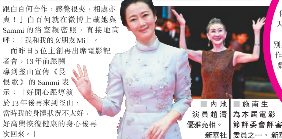
內地演員趙濤優雅亮相。 新華社 施南生為本屆電影節評委會評審委員之一。 新華社