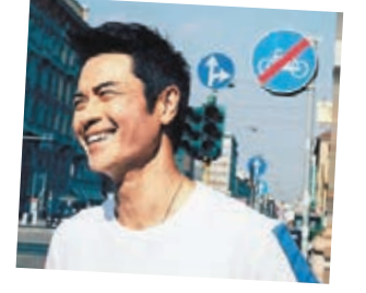
鄭嘉穎近日終於開設IG戶口。