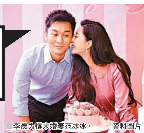
李晨力撐未婚妻范冰冰。 資料圖片