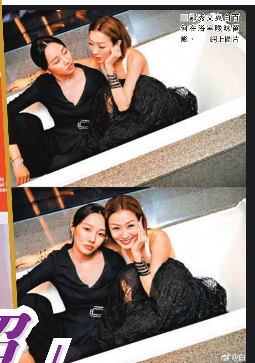
鄭秀文與白百何在浴室曖昧留影。