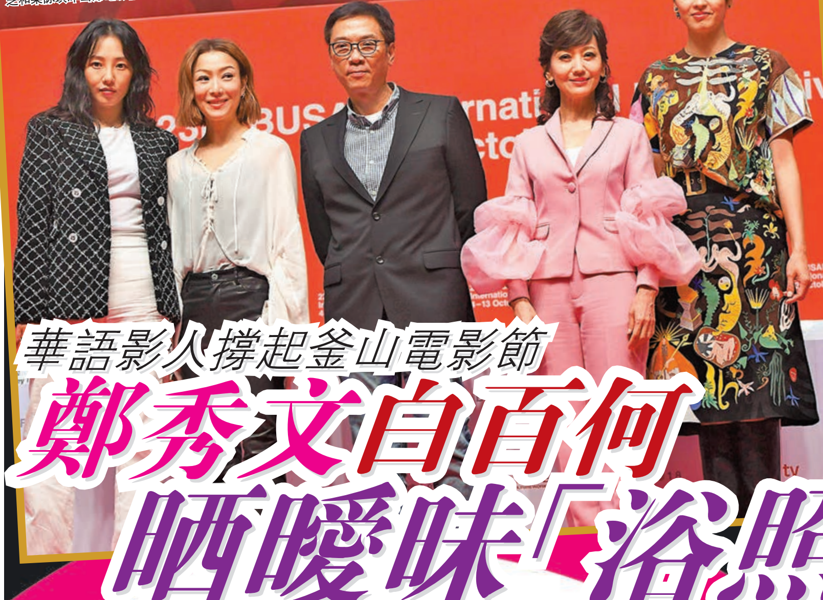
左起：白百何、鄭秀文、關錦鵬、趙雅芝和梁詠琪昨出席電影記者會。