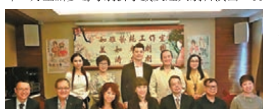
記者會介紹未來數月的連場演出戲碼。

「美如粵劇團」及「美濤粵劇團」在十月至明年一月主辦多場粵劇折子戲及經典劇目演出，11