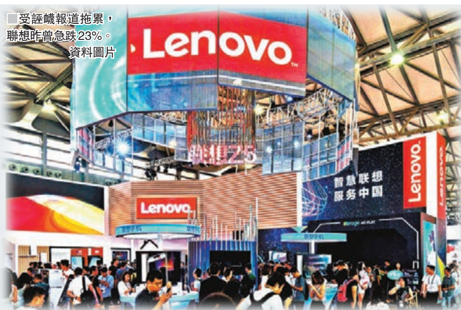
受誣衊報道拖累，聯想昨曾急跌23%。