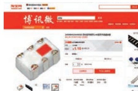
■ 彭博報道中提及的所謂「間諜芯片」，內地網民指疑是藍牙天線濾波器，淘寶網每粒僅賣1.15元人民幣。

其實，毋須閱讀這類科普文章，普通人也能看出彭博這篇報道的荒謬之處。中國在芯片技術上與美國仍有巨大差距，如果能研發出如此神奇的「間諜芯片」，美國早前宣佈制裁中興通訊時，整個中興通訊又怎會即時休克？中興通訊生產的只是低端智能手機吧，在連低端手機芯片都無能