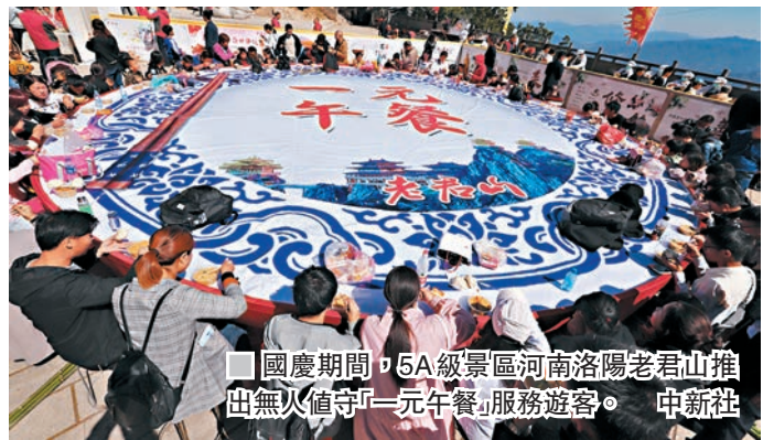
國慶期間，5A級景區河南洛陽老君山推出無人值守「1元午餐」服務遊客。

熱門景區的「麵攤」竟無人看守，只有一個收款箱，上面寫着「1元午餐，無人值守，自覺投幣，自助找零」，長達數百米、近千人的遊客隊伍自覺投幣，取餐……國慶期間，河南洛陽老君山景區推出「一元無人售賣午餐」，吸引上千名遊客排隊就餐。經最後盤點，當日共賣出1,200碗午餐，收入1,275元(人民幣，下同)，多出了75元「善款」。看慣了景區欺客宰客的遊客紛紛表示，花一元錢就能在景區吃上一碗當地特色穆湯麵、一根香腸和一個饅頭，感覺非常溫暖。