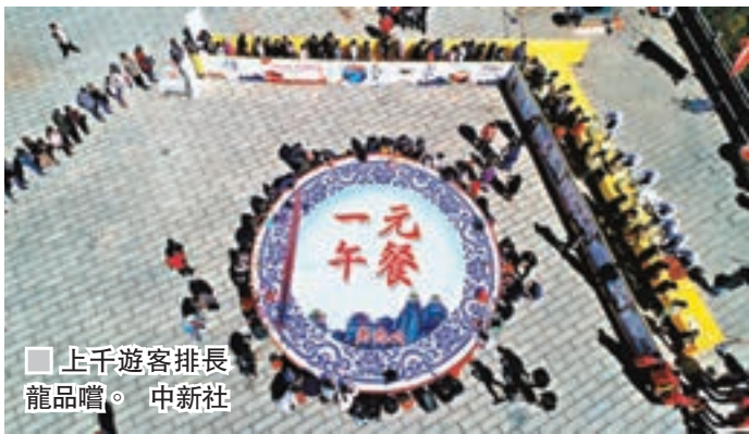
上千遊客排長龍品嚐。

據報，景區現場支着四口大鍋，廚師們現場製作熱騰騰的麵條，取餐後大家可以圍坐大圓桌就餐。