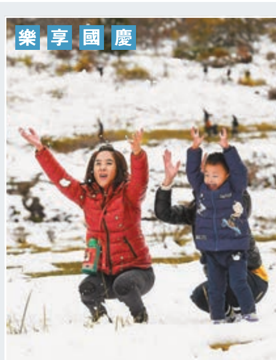
10月4日，國慶假期第4日，四川阿壩州理縣畢棚溝景區風光如畫，遊人如織。圖為民眾在畢棚溝景區玩雪。