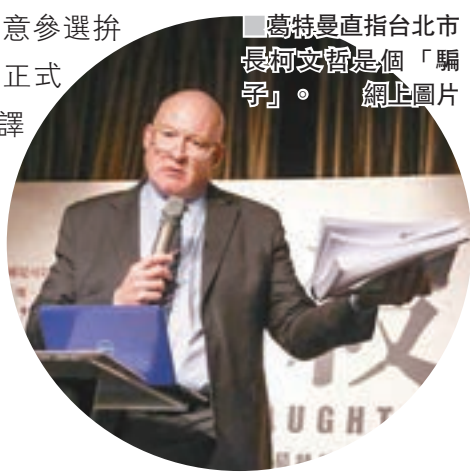
葛特曼直指台北市長柯文哲是個「騙子」。

香港文匯報訊 據中央社報道，有意參選連任的無黨籍台北市長柯文哲昨日正式控告美國作家 Ethan Gutmann (台譯：伊森·葛特曼) 妨害名譽。該名作家在數年前在一部關於器官移植的書中，提及柯文哲帶病人到大陸進行器官移植，2日又在國際記者會上指責柯文哲是「騙子 (liar)」，聲稱柯的行為助長不法器官移植。