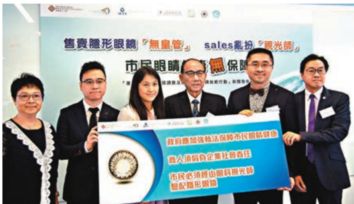
■六大眼科視光機構「放蛇」時發現，部分店舖在沒有眼科視光師的情況下，違法替客人驗配隱形眼鏡。

香港文匯報訊(記者 高俊威)香港約有120萬人佩戴隱形眼鏡，不少人卻只視之為飾物。其實隱形眼鏡屬醫療儀器，若使用不當會對眼睛造成損害。本港六大眼科視光機構進行調查發現，近80%受訪者佩戴隱形眼鏡曾遇不適，但當中76%只自行處理，並未求醫。機構「放蛇」時又發現，部分店舖在沒有眼科視光師的情況下，違法替客人驗配隱形眼鏡，要求政府加強執法。