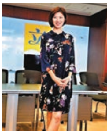
■容海恩出席網台節目訪問，談到第一次做媽媽的心情。資料圖片

香港文匯報訊(記者 文森)新民主黨立法會議員容海恩(Eunice)是首位任內懷孕的議員，她昨日出席網台節目「議會內外」並接受前立法會議員劉慧卿訪問，談到第一次做媽媽的心情。她指過了最辛苦的幾個月，因懷孕初期有孕吐情況，身體荷爾蒙出現變化，令到身體感不適，現時情況已穩定下來。至於BB的性別，Eunice就大賣關子，說到時大家便知道。